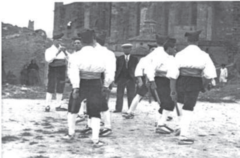
Picant a l'era darrera de Santa Maria l'any 1929. Vestits fets especials per anar a Madrid.

Esperonada per l'èxit, aquesta colla va actuar per la processó de Corpus de l'any 1927 i féu dues sortides a Santa Coloma de Queralt (27 d'agost de 1927) i a Reus (15 d'octubre de 1927). Actuà també per la Festa Major de 1928. Després s'obre un altre període sense manifestacions bastoneres destacables. Només remarcar que el Centre Català va participar al IV Aplec Excursionista de les Comarques Tarragonines celebrat a Poblet el 18 de maig de 1930, on membres del Centre picaren alguns balls. Fet que demostra que durant aquesta època les colles sorgien dins d'entitats més àmplies. 22