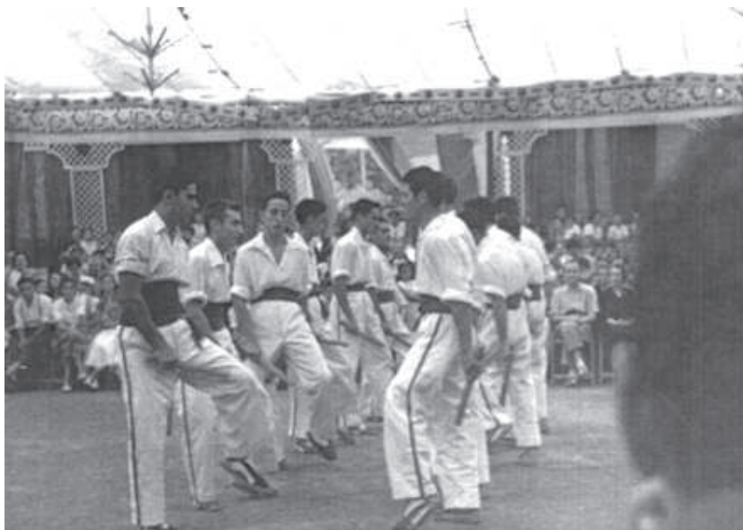
Actuació del Ball de bastons a l'envelat del Casal. Festa Major 1955.