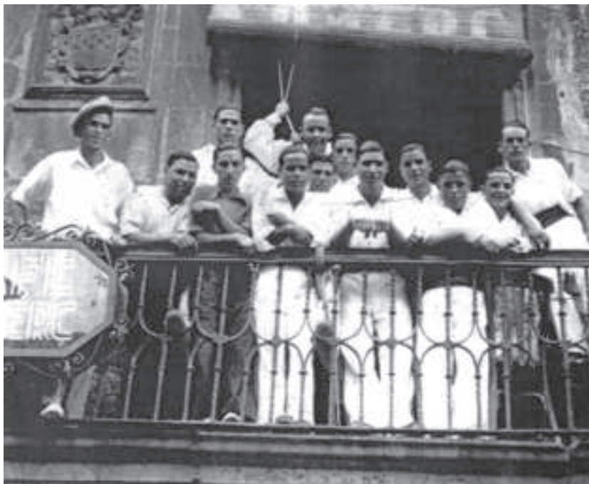
Al Balcó de Cal Marcelino (Actual Casa Desclergue) Festa Major de l'any 1932.

De 1930 al 1934 no hi ha Ball de Bastons i a més es perden altres manifestacions folklòriques, fins el punt que en un article a Aires de la Conca firmat per un tal P. es parla de la pèrdua dels Torraires, del Ball de Serrallonga i del Ball de Sant Isidre, diu que encara el Ball de Bastons que de tant en tant se'n pot veure alguna mostra.