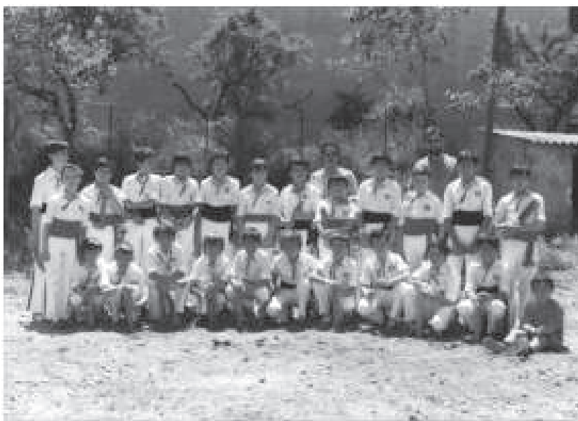
Primera colla infantil. Festa Major 1979.