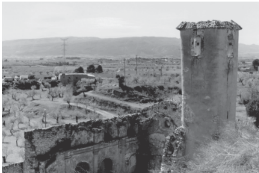
Les restes de l'antiga església d'Ollers l'any 1993.

Actualment l'antiga església d'Ollers presenta un estat lamentable. L'interior està ple de terra i vegetació. Resten, únicament en peu, la façana, la base del campanar i el lateral dret que fa de paret mitjanera amb el cementiri, amb els arcs i les pilastres.