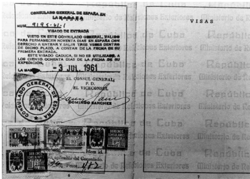
Anvers i revers del passaport cubà de Conangla i Fontanilles