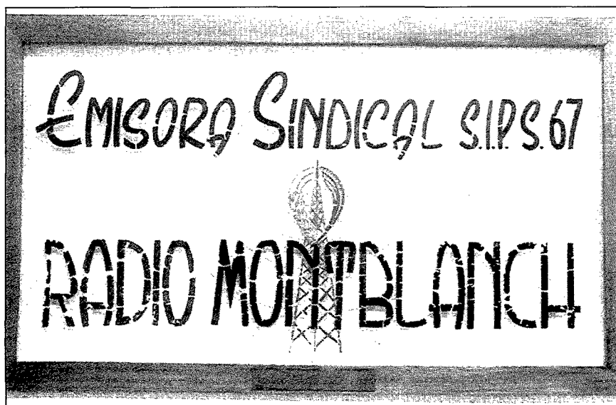
Fig.1. Rètol indicatiu que es concedí a Ràdio Montblanc l'any 1956 com a emissora sindical

El gran problema amb què ens vam trobar era la dificultat per recordar de molts dels entrevistats. La frase que més han repetit tots ells ha estat: "No me'n recordo, fa ja tants anys...!" És cert, han passat molts anys d'ençà que l'emissora va començar a funcionar l'any 1947 i la gent té una vaga impressió d'aquella etapa. Pel que fa a la segona etapa, ja més recent, els entrevistats no sabien delimitar els programes, els locutors, les hores d'emissió dins de l'evolució que l'emissora va anar fent. El cas més extrem de dificultat per