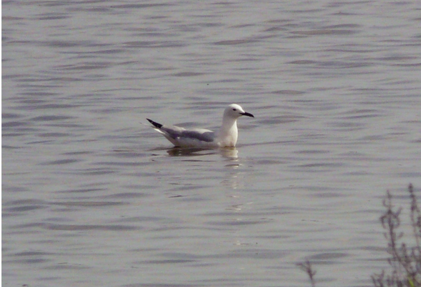
Gavina de bec prim Larus genei (Slender-billed Gull), estany Pudent (Formentera), maig de 2013.