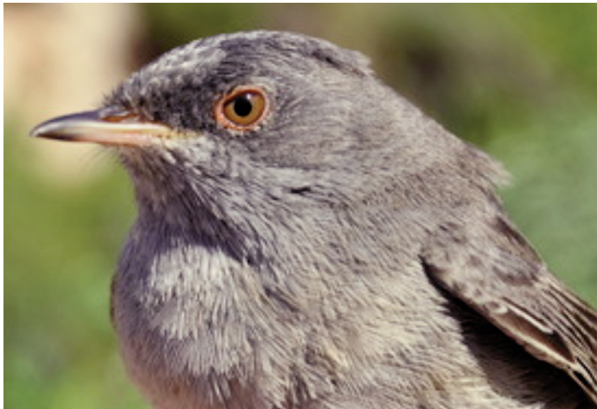
Foto 8. Busqueret sard Sylvia sarda (Marmora's Warbler), mascle de segon any calendari, illa de l'Aire (Sant Lluís, Menorca), 17 d'abril de 2011.

amb 32 registres (14/IV, 17/V, 1/VI), primer el 6 d'abril i darrer el 3 de juny; pas postnupcial, tan sols tres cites, el 5, 22 i 25 de setembre.