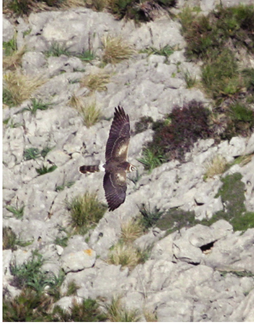
Foto 3. Arpella pàl·lida Circus macrourus (Pallid Harrier), femella de segon any, talaia d'Albercutx (Pollença), 10 d'abril de 2010.

Mallorca : aeroport de Palma, un adult, hi ha fotos, el 25 de novembre de 2011, atropellat a prop de la torre de control (José Luis Martínez).