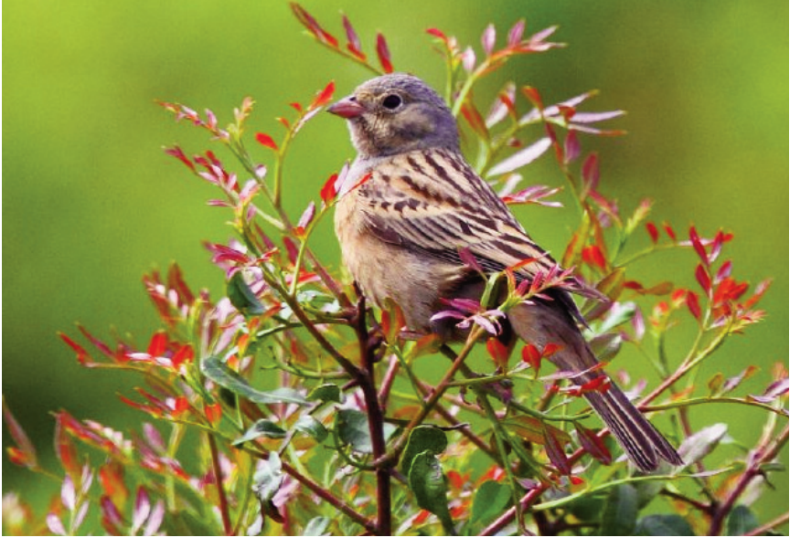
Foto 13. Hortolà cendrós Emberiza caesia (Cretzschmar's Bunting), probablement de segon any calendari, Cabrera, 1 de maig de 2011.

Llabrès) i 2 de maig de 2011 (Eduardo Amengual).