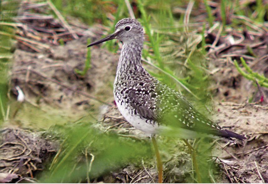
Foto 5. Camagroga Tringa flavipes (Lesser Yellowlegs), s'Albufera de Mallorca, 26 d'abril de 2011.

escàs amb 4 registres (3/IV, 1/V), primera observació l'11 d'abril i darrera el 10 de maig; presència estival, el 25 i 27 de juny i 2 de juliol; pas postnupcial amb 12 cites (3/VIII, 7/IX, 2/X), primer el 6 d'agost i darrer el 26 d'octubre.