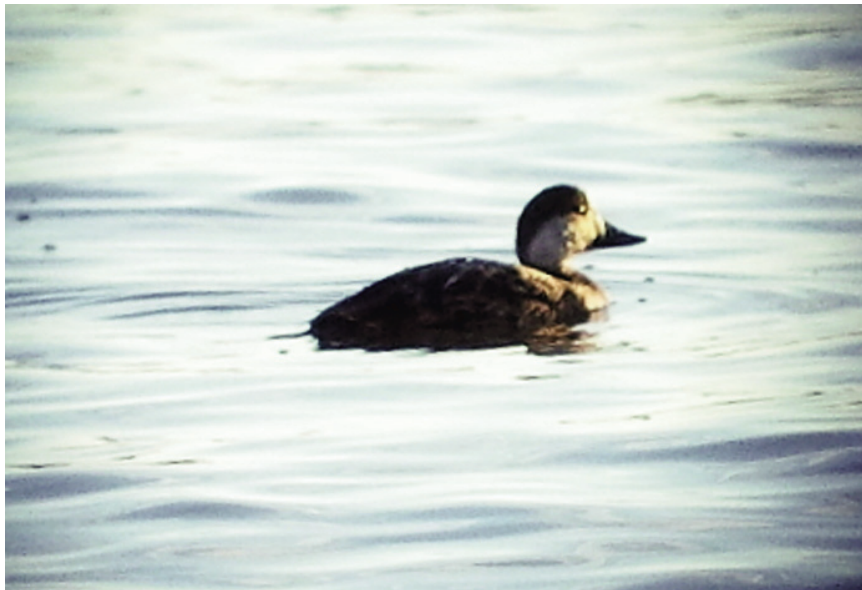
Foto 1. Negreta Melanitta nigra (Common Scoter), femella, Portocolom (Felanitx), 21 de gener de 2013.

Mallorca : s'Albufera, un exemplar el 20 de setembre de 2013, hi ha foto (Maties Rebassa).