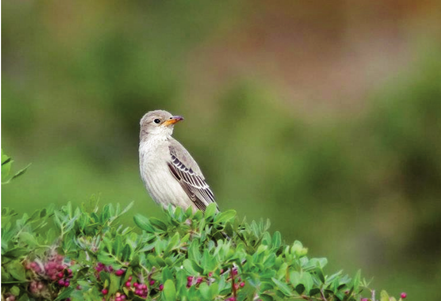
Foto 12. Estornell rosat Pastor roseus (Rose-coloured Starling), primer any calendari, Cabrera, 20 d'octubre de 2011.