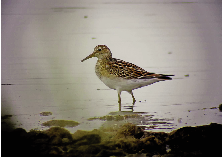
Foto 4. Corriol pectoral Calidris melanotos (Pectoral Sandpiper), au de primer any, Salobrar de Campos, 22 de setembre de 2011.

ha un cita al gener. En el pas prenupcial només una, el 4 d'abril; i en el pas postnupcial, 23 registres (6/VIII, 13/IX, 4/X), del 16 d'agost fins al 30 d'octubre.