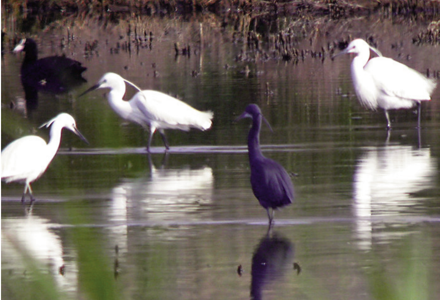
Foto 2. Agró d'escull Egretta gularis gularis (Western Reef Heron), adult, s'Albufera de Mallorca, 28 d'abril de 2011.

entre les subespècies E. g. gularis i E. g. schistacea .