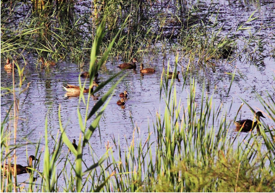
Foto 3. Polls de rabassot menut Aythya nyroca entre un grup variat d'ànecs al Prat de Son Saura del Nord el 17 de juliol del 2012.