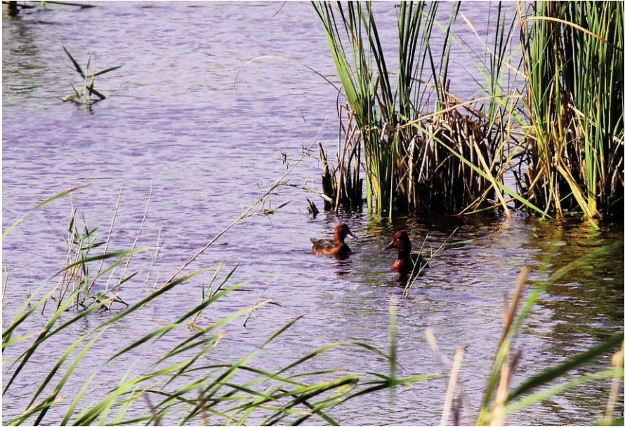
Foto 2. Parella territorial de rabassot menut Aythya nyroca al Prat de Son Saura del Nord, 12 de juny del 2012.

Photo 2. Territorial pair of Ferruginous Duck Aythya nyroca at Prat de Son Saura del Nord, 12th June 2012.