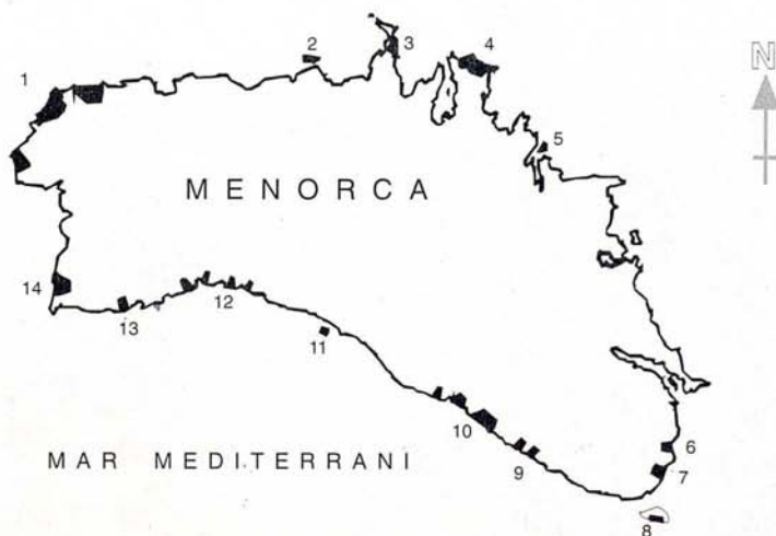
Figura 1. Distribució de les colònies de vinjola ( Apus pallidus ) a la costa menorquina, amb (*) els nous emplaçaments: 1 Costa nord-oest; 2 Illa Bleda; 3 Cap Cavalleria; 4 Mola de Fornells; 5* Illes d'Addaia; 6 Rafalet; 7* Alcaufar; 8* Illa de l'Aire; 9* Binidali-Cova Degollador; 10 Canutells-Cala'n Porter; 11 Escull de Binigaus; 12 Mitjana-Macarella; 13* Son Saura-Cala Vell i 14* Artrutx.

costa de Cala'n Porter, a l'Escull de Binigaus i a la costa nord-oest de Menorca (MUNTANER et al. , 1984). I segons afirma MOLL (1957) és molt abundant com a nidificant a la costa sud de l'illa.