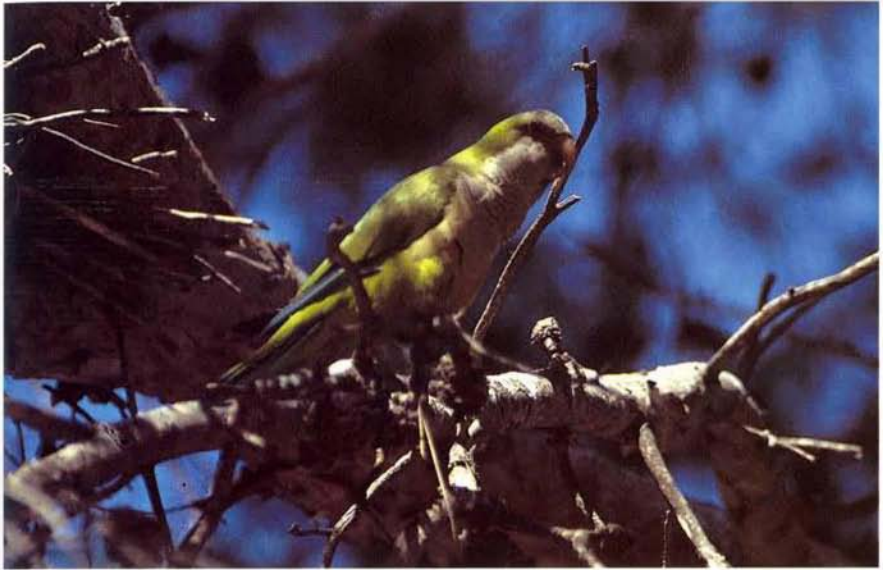
Foto 1.- Cotorra de pit gris Myiopsitta monachus (Monk Parakeet). Son Dameto (Palma), adult, primavera 1994.

Son Comes (Esporles), colònia urbana, situada a la vila nova, h'hi ha establerta una parella que ha construït un niu sobre una palmera.