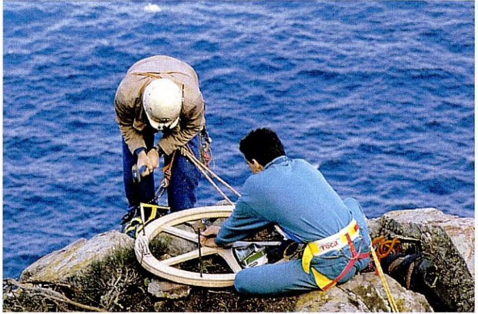
Foto 2. Arranjament i millores del niu, novembre 1991. Foto: Evaristo Coll. Fixing and improving the nest, November 1991. Evaristo Coll.

Foto 1. Instal·lació de la plataforma artificial, desembre 1989. Foto: Rafel Triay. Building the artificial platform, December 1989. Rafel Triay.