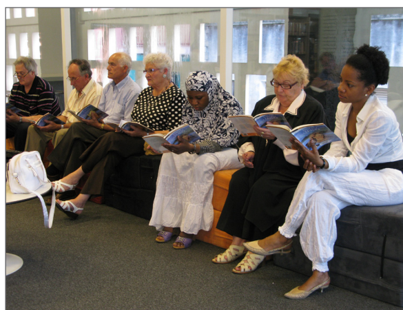
Club de LF de la Biblioteca Mestre Martí Tauler (Rubí).

Una de les eines més efectives per fer un bon ús dels llibres de LF i fomentar així la lectura entre els col·lectius més allunyats de la literatura són els clubs de lectura fàcil. L'ALF els potencia i en difon les activitats. A final de 2011, hi ha més de 100 clubs de LF a tot l'Estat espanyol, 98 dels quals es duen a terme en biblioteques, escoles i entitats de Catalunya. Alguns organitzen trobades i xerrades amb autors.