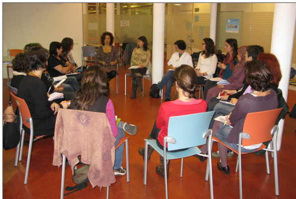
Taller formatiu a la Biblioteca Ignasi Iglésias - Can Fabra.

Per concloure la difusió d'aquest projecte, el 4 de novembre va tenir lloc un taller formatiu per dinamitzar els llibres de lectura fàcil i els clubs de LF, a la Biblioteca Ignasi Iglésias - Can Fabra. Hi van participar representants de 15 entitats del districte.