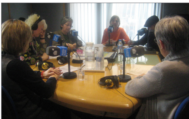
Programa de Ràdio Estel: Catalunya sense barreres .

I també cal destacar la presència mensual al programa de Ràdio Estel Catalunya sense barreres , des del setembre de 2011. El programa és un magazín social en què l'ALF ha pogut parlar sobre diferents temes relacionats amb la lectura fàcil: els clubs de LF, el procés literari, l'experiència del club de LF de la presó Model, etc.