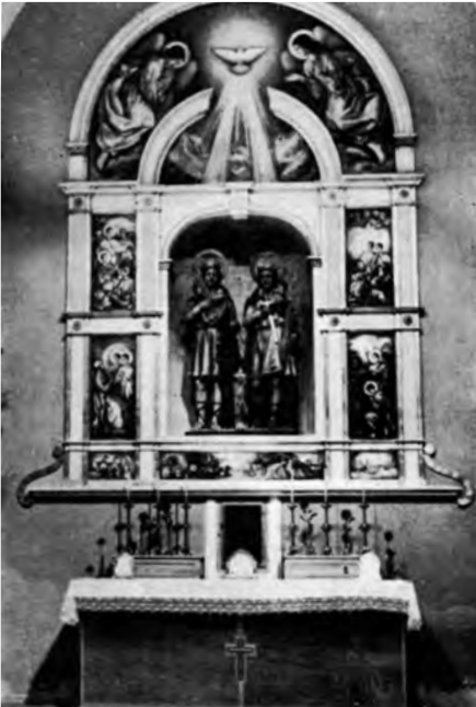
Altar dels Sants Patrons anys seixanta.

La nota més antiga sobre la devoció dels cubellencs a sant Abdon i sant Senén, protectors de l'agricultura, data del 24 d'agost de 1580. És probable que en aquesta època els dos sants ja tinguessin altar propi a la primitiva església de Santa Maria. En el llibre més antic de les administracions que hi havia entre 1500 i 1606 a Cubelles, comença a figurar-hi, el 1603, l'administració de sant Nen i sant Non, com també són coneguts aquests sants. 29 Els administradors havien de ser fadrins, un del poble i l'altre de les masies. No va ser, tanmateix, fins al 1647 que sant Abdon i sant Senén foren elegits copatrons de la nostra vila. 30 A partir d'aleshores la diada dels sants patrons, el 30 de juliol, passà a celebrar-se amb tanta solemnitat com la Festa Major.