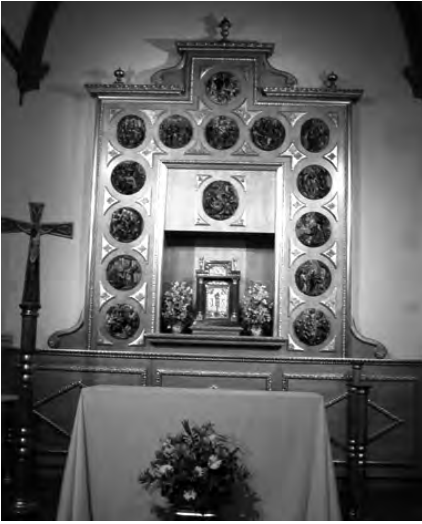
La capella del Santíssim, actualment.