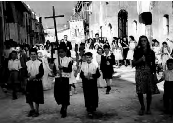
La processó del Sagrat Cor al carrer de Sant Antoni, als anys quaranta.

La confraria de l'Apostolat de l'Oració s'encarregava del culte de l'altar del Sagrat Cor de Jesús. Es fundà en època desconeguda i tenia els seus propis estatuts. El dia que nens i nenes feien la Primera Comunió la confraria els imposava la medalla de l'associació, 63 cosa que als anys seixanta del segle XX passà a fer la confraria de les Filles de Maria. L'últim rector que esmenta aquesta