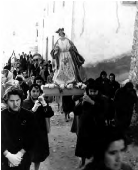
Una processó als anys cinquanta.