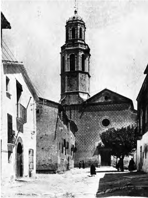
L'església i la rectoria, a principi del segle XX.

Això va permetre reprendre el culte, l'any 1943.