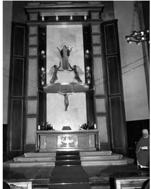
Altar major any 1999.