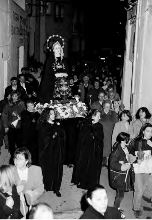
Processó del Divendres Sant, a finals dels noranta.