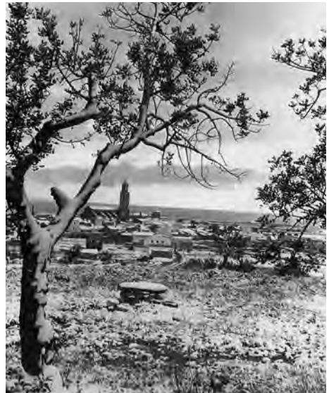
La pedra de beneir, en la nevada de 1962.