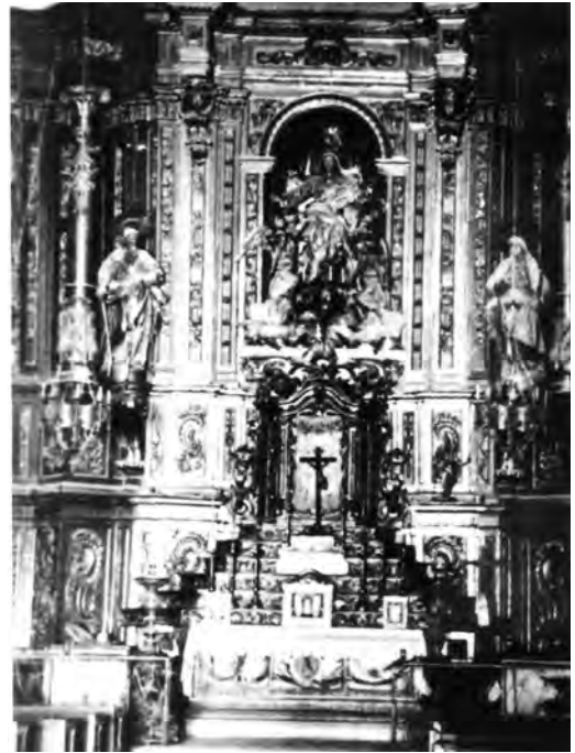
Dues imatges de l'altar major, l'any 1916.

la cara de la Mare de Déu, hi ha un braç de palmatòria de llauna a cada costat amb el broc corresponent.