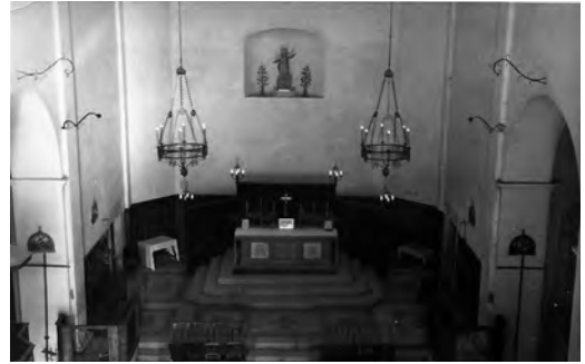
Altar major any 1955.