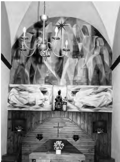
Altar de la Mare de Déu de Montserrat, a l'actualitat.