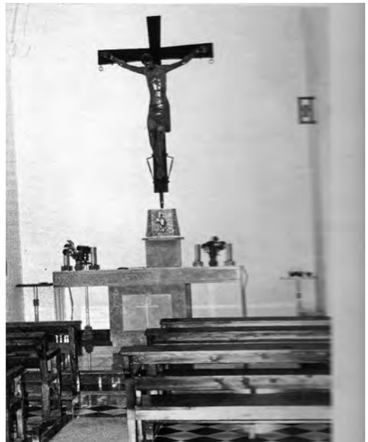
Dues imatges de la capella del Santíssim anys cinquanta i seixanta.