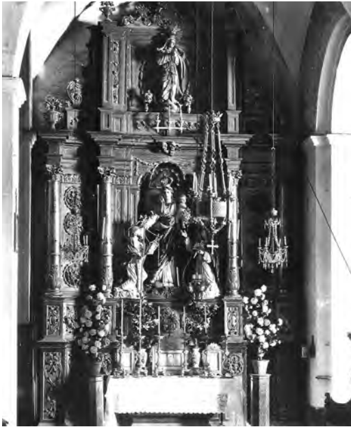
Altar del Roser abans de la Guerra Civil.