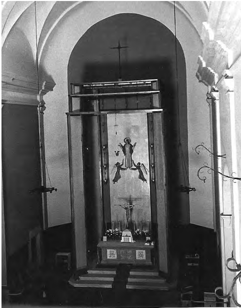
Altar major amb el baldaquí, estrenat el 1962.