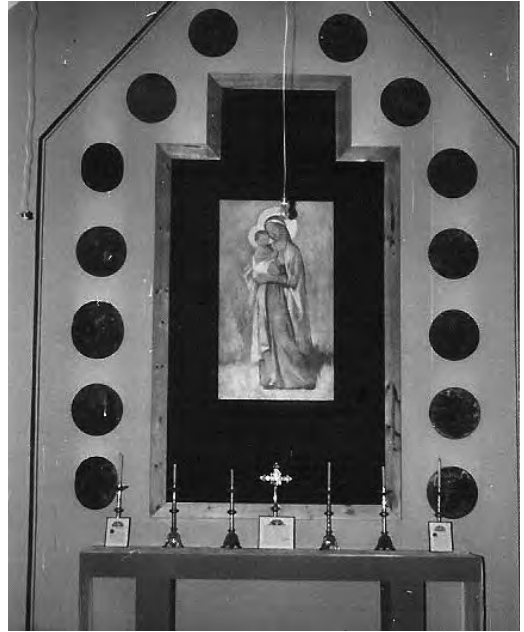
Altar del Roser anys cinquanta i seixanta.