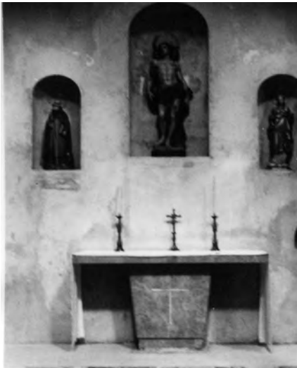
Altar de sant Sebastià anys cinquanta.