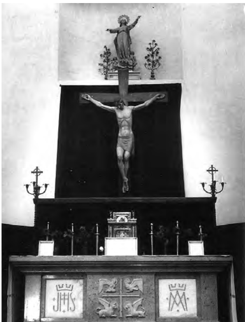
Altar major any 1957.