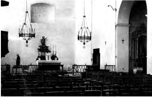
Altar major a principi dels cinquanta.