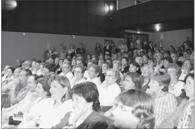
El cinema Mediterrani, ple a vessar.

L'acte es va cloure amb la signatura de llibres, encara que la gran afluència de públic obligà a ajornar-ne algunes a la setmana següent.