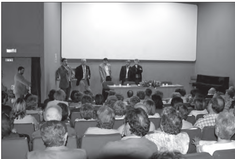
Un altre aspecte de la sala.

Dintre del mateix certamen cal parlar d'altres socis de la nostra entitat que foren guardonats des que el Premi d'Investigació es va convertir en l'actual Beca, l'any 2000. Així, tenim que el 2001 va ser Neus Capdet Sardà, aleshores membre de la junta dels Amics del Castell, qui va guanyar amb el treball Un pas per la guerra , realitzat junta-