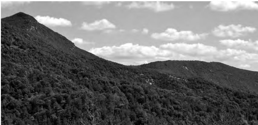
Lloc aproximat on es va produir l'atac de les forces carlines contra la columna de Nouvilas que anava a Olot per a socórrer els liberals assetjats pels carlins de Savalls. La perspectiva s'obté de prop de Colldecarrera i permet veure una part de la Vall del Bac. Autor: Jesús Gutiérrez

Lo ignoramos de todo punto, porque ni cartas ni periódicos han arrojado hasta ahora alguna luz sobre este funesto suceso; pero el dia 17 del mes citado los infelices carabineros en número de 75, y entre ellos un oficial, fueron conducidos á las inmediaciones del cementerio de Llayés (sic), distrito municipal de Ripoll, y allí inmolados cruelmente, casi al mismo tiempo que 110 individuos del ejército que habían sido designados por la quinta fatal, entre ellos un médico, un jefe y 12 oficiales, caían también bajo el plomo fratricida en las cercanías del cementerio de San Juan de las Abadesas, -salvándose milagrosamente cuatro, que se ocultaron sin ser vistos bajo un montón de maderos que había en el sitio de la ejecución, y sobre el cual arrojaban los capotes las desdichadas víctimas.»