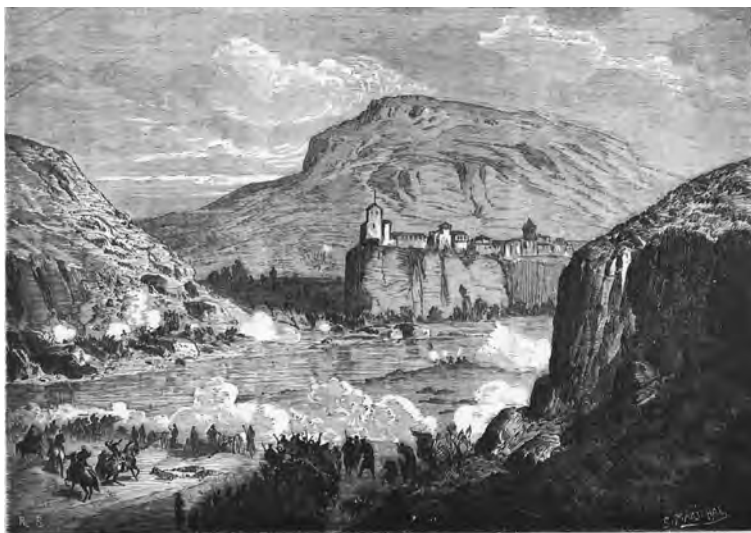
ACCION DE CASTELLFOLLIT ENTRE LA COLUMNA DEL GENERAL NOUVILAS Y LA FACCIÓN SAVALLS.

«Tiempo hacía que la villa de Olot se encontraba asediada por los carlistas, cuando el general Nouvilas, que marchaba en socorro de la plaza al frente de una columna compuesta por una sección de carabineros, encontró á la facción Savalls en la mañana del 14, hacia el punto denominado Pla de Fort, cerca de Castellfollit, librándose un sangriento combate que tuvo desgraciado éxito: la columna se batió heroicamente, pero fue por último dispersada sufriendo lamentables pérdidas, y su jefe quedó herido y prisionero, resultando de este hecho de armas la rendición de Olot á los carlistas.»