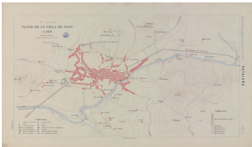
Reproducció del plànol d'Olot de 1874

força no va tenir prou capacitat per derrotar l'exèrcit republicà. En aquest exèrcit es va anar restablint la disciplina, després del cop del general Pavía, el 3 de gener de 1874. Això, però, no li evità patir noves derrotes, com la del Toix, motiu d'aquest treball, o la pèrdua de poblacions com Vic, Manresa, Olot, Ripoll o la Seu d'Urgell, darrera plaça forta que mantingué el carlisme. Mentre l'exèrcit de la República no acabava d'anar consolidant la seva reestructuració, el carlisme va poder assentar-se a les comarques de la mntanya catalana i aspirar a consolidar-se com un estat alternatiu al liberal. En aquesta línia cal veure la creació, el juliol de 1874, de la Diputació de Catalunya, presidida pel general Tristany, o la publicació, el desembre, del Boletín Oficial del Principado de Cataluña , encara que la seva vida va ser efímera. Només durà fins al març de l'any següent, quan tot l'entramat institucional carlí va quedar difuminat després del cop d'estat de Martínez Campos, el 29 de desembre de 1874, general que passà a dirigir les tropes liberals al Principat.