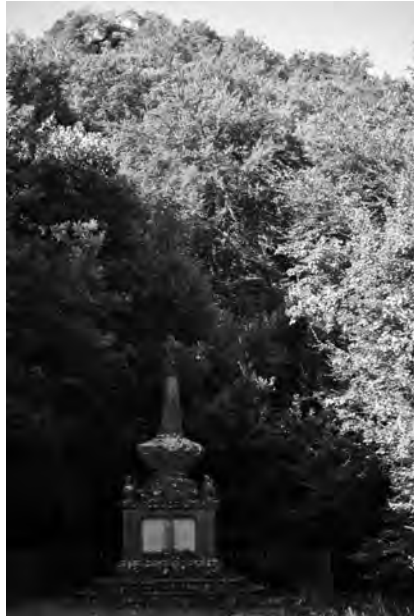
Monument als militars afusellats a Llaés, conegut com el Panteó. Autor: Jesús Gutiérrez