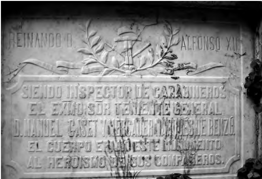
Autor: Jesús Gutiérrez