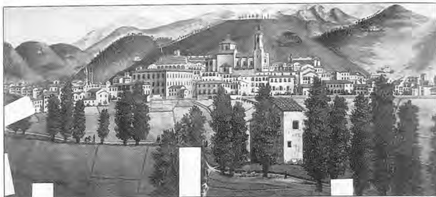
Fig. 6.- Perspectiva d'un paisatge urbà amb la línia d'horitzó baixa. Aquarel·la sobre paper. 38'2x86 cm. Els pedaços que veiem són sobre uns estrips de paper, ja que actualment els quatre dibuixos estan en procés de restauració.

alta. Són quatre treballs molt il·lustratius dels mètodes més clàssics del dibuix de la perspectiva cònica, que poden molt ben ser uns exercicis acadèmics.