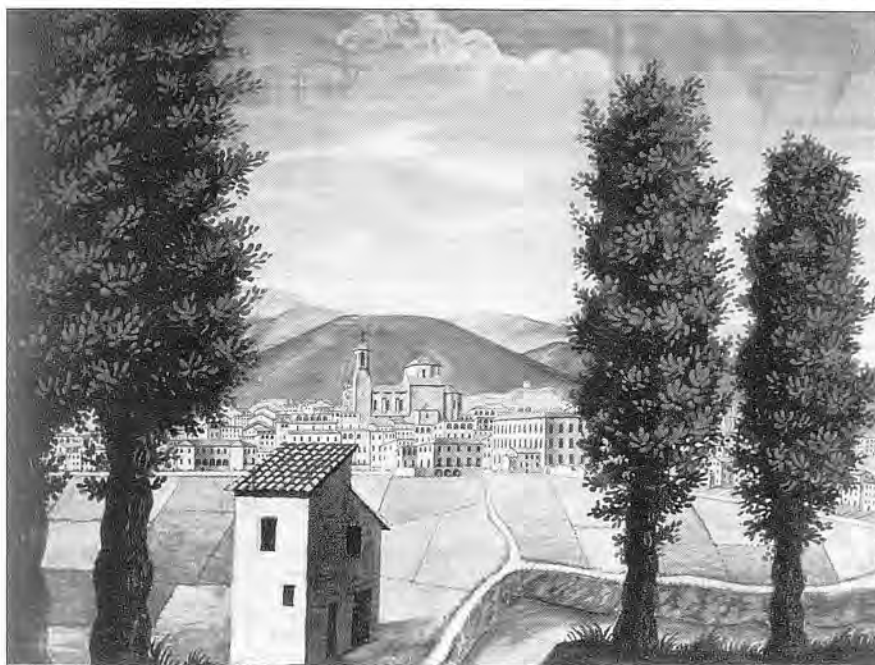
Fig. 5.- Perspectiva d'un paisatge urbà amb la línia d'horitzó alta. Aquarel·la sobre paper. 63x86 cm.

Mentre que aquest darrer dibuix aquarellat és un estudi de perspectiva frontal, el primer ho és de perspectiva obliqua. I tot seguit veurem dos dibuixos d'un mateix paisatge: un, vist en una línia d'horitzó baixa; i l'altre,