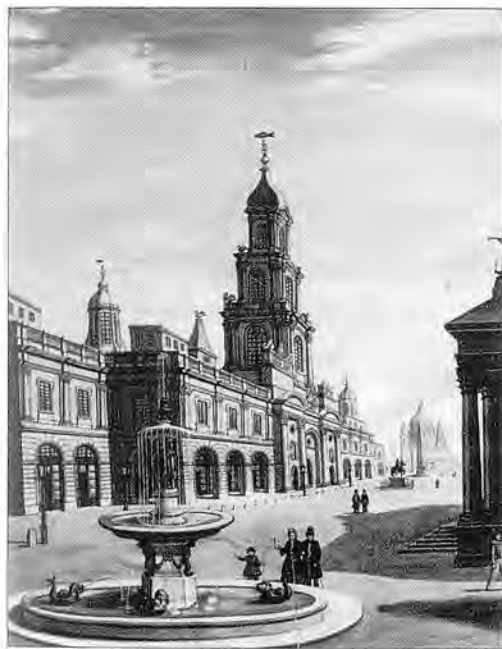
Fig. 3.- Perspectiva obliqua d'una plaça. Aquarel·la sobre paper, 48'2x60 cm.