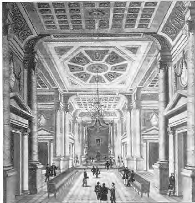
Fig. 4.- Perspectiva frontal d'un interior. Aquarel·la sobre paper. 81x84'5 cm.

Un altre dibuix, de 81x84'5 cm, és un interior d'una estança, semblant a un saló del tron, amb figures que s'hi passen en posició hieràtica i sense cap estudi anatòmic (fig. 4). Aquesta mateixa característica la veiem en les figu-