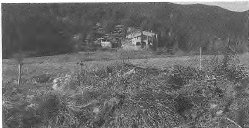
El mas Campderrich, bressol de la progènie d'aquest cognom, situat a la idil·lica i petita vall de Sant Iscle de Colltort.