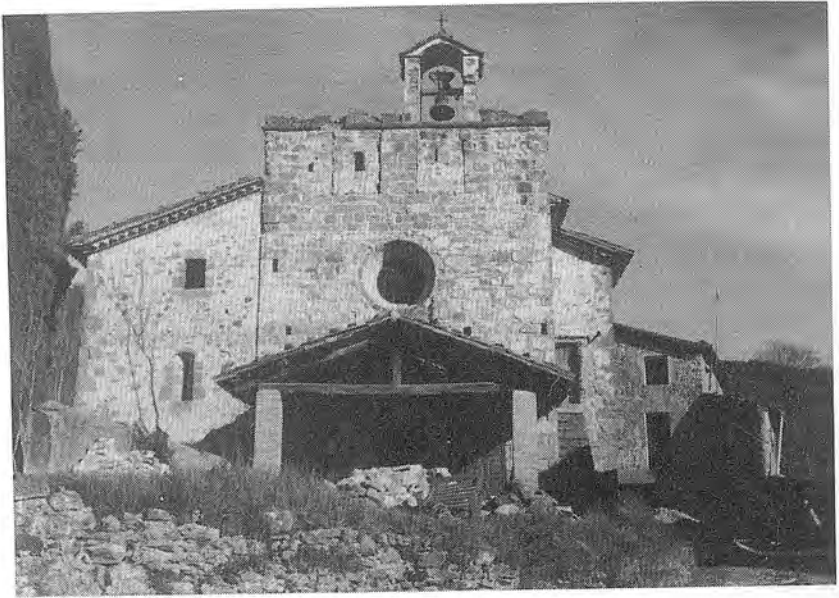
L'església parroquial de Sant Iscle i Santa Victòria de Colltort, on foren batejats, fins ben tard del segle passat, tots els rebrols de la nissaga Campderrich.