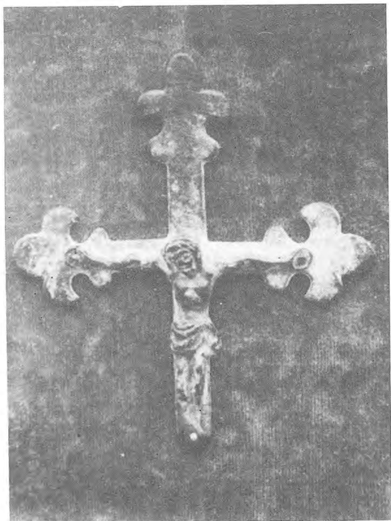
Crist tipus Llemotges quart de la col·lecció Coromina del Castell de Porqueres (Banyoles)