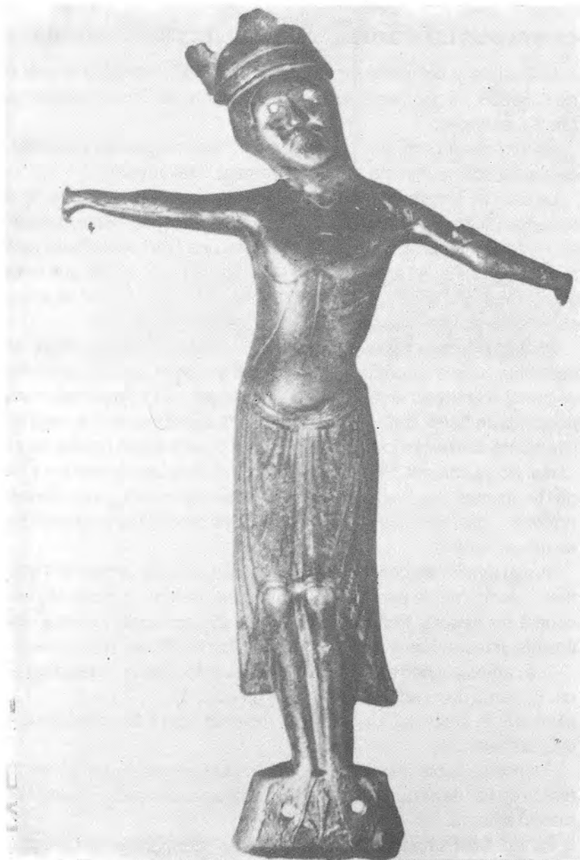
Crist tipus Llemotges segon procedent de la Cerdanya. Col·lecció particular Barcelona.