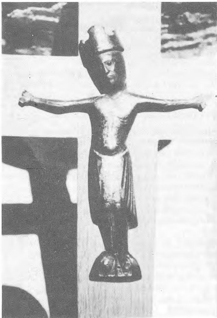
Crist tipus Llemotges segon, procedent de Centenys (Museu Arqueològic de Banyoles)