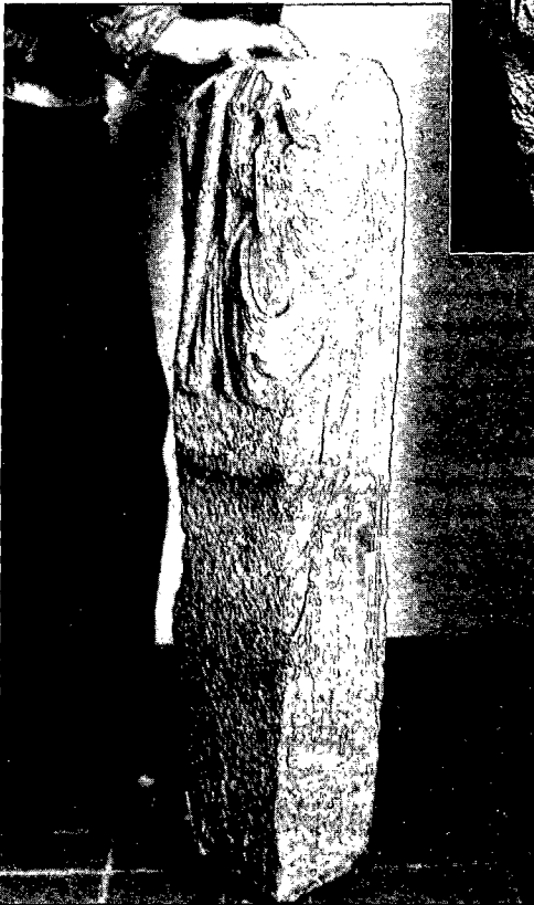
Fig 3- En el lateral dret de la imatge, el relleu romànic ha estat menys destruït.