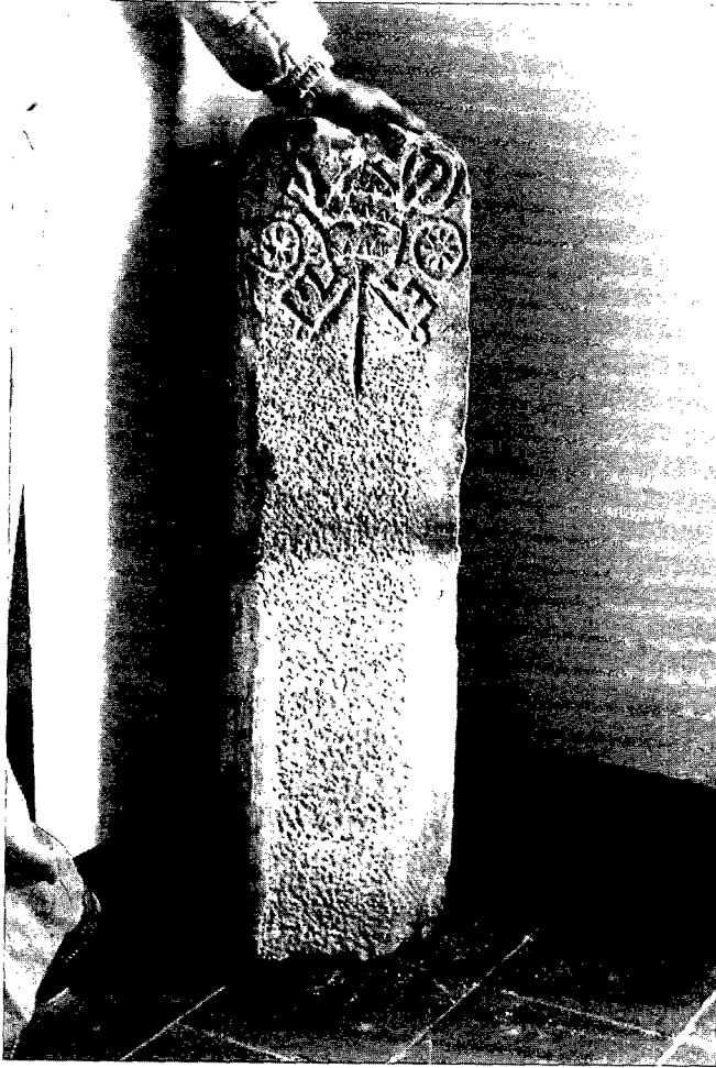
Fig 4.- Revers de la peça amb l'emblema de Sant Pere de Rodes que hi fou esculpit per utilitzar-la de fita.