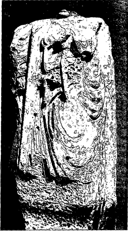
Fig 2- Aspecte de la cara frontal del relleu, amb les claus i una part del bàcul.