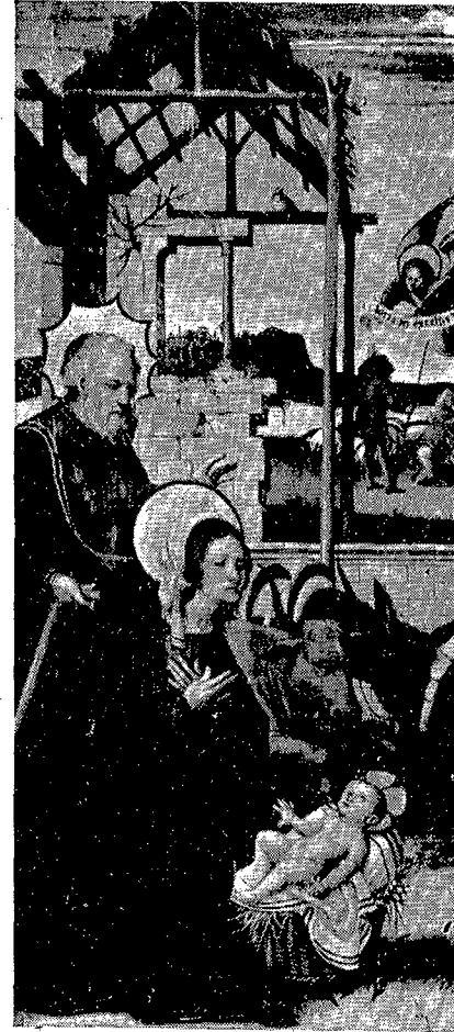
2. Santa María de Sagaró.—Tabla del Nacimiento.