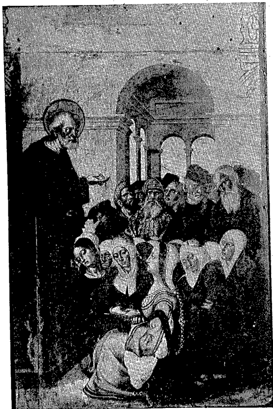
1. San Pedro de Montagut.—La predicación de san Pedro.