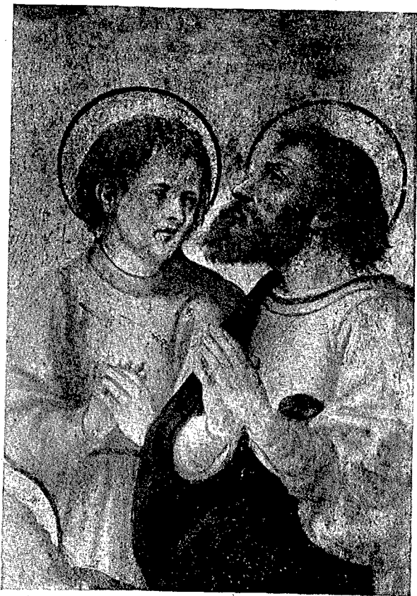
1. Colección Pérez Xifra.—Tabla de la Ascensión. Detalle.