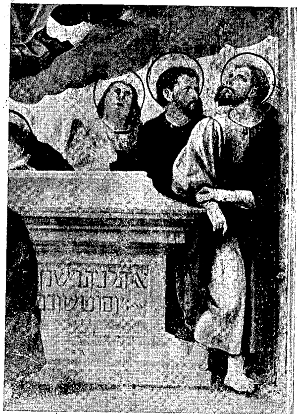
2. Colección Pérez Xifra.—Tabla de la Asunción. Detalle.