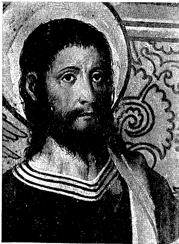
2. San Andrés de Llorona. — Detalle de la tabla central. San Bartolomé.