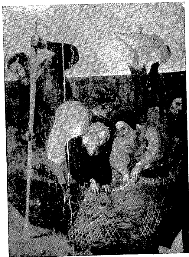
2. San Pedro de Montagut. — La pesca milagrosa. Detalle.