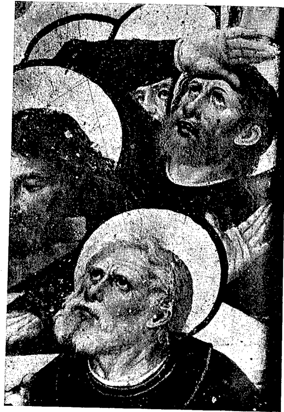
2. Santa María de Sagaró.—Detalle de la tabla de la Asunción.