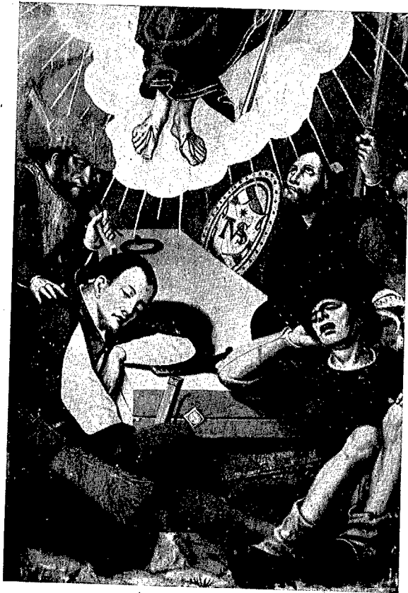
1. Santa María de Sagaró.—Detalle de la tabla de la Resurrección.