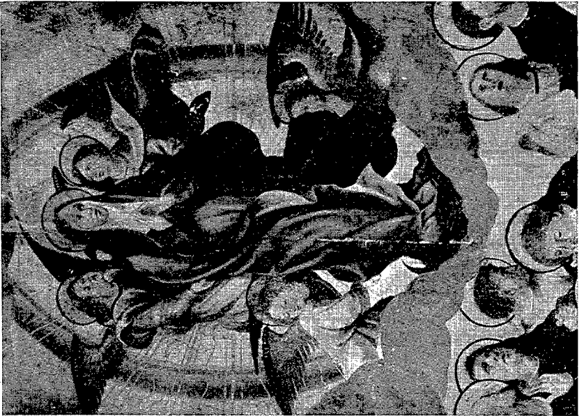
2. Colección Pérez Xifra.— Tabla de la Asunción. Detalle.