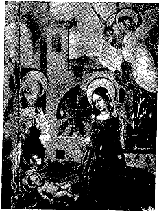
1. Santuario de la «Mare de Déu del Mont». — Tabla del Nacimiento.