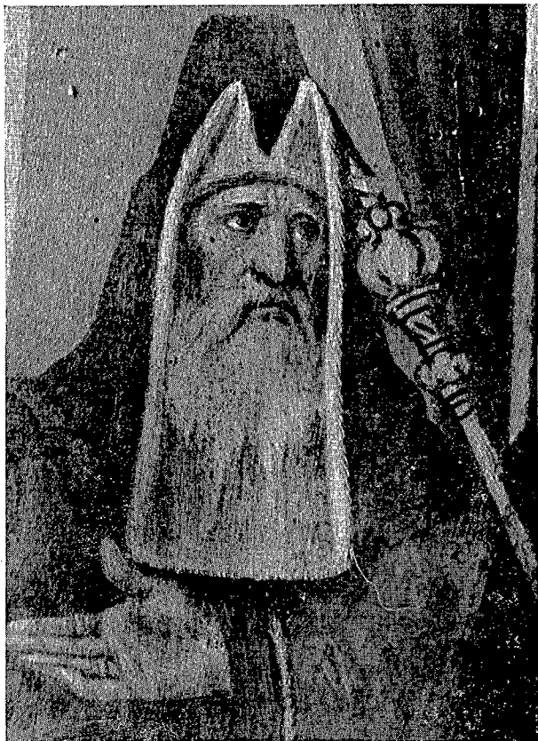
1. San Andrés de Llorona. — San Bartolomé en presencia de Astragés. Detalle.