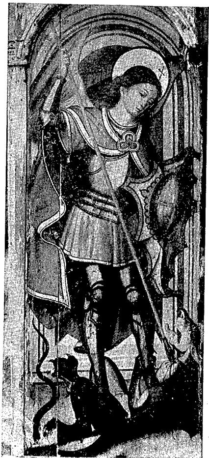
1. San Pedro de Lligordá.—San Miguel.