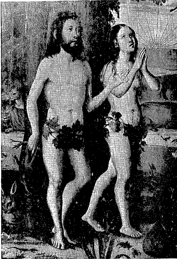
1. Santa María de Sagaró. — Adán y Eva. Detalle de la Creación.