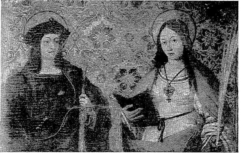
1. Museo Diocesano de Gerona.— San Acisclo y santa Victoria. Detalle.