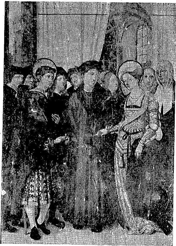
1. Colección Rafael Masó Valentí. — Bodas místicas.