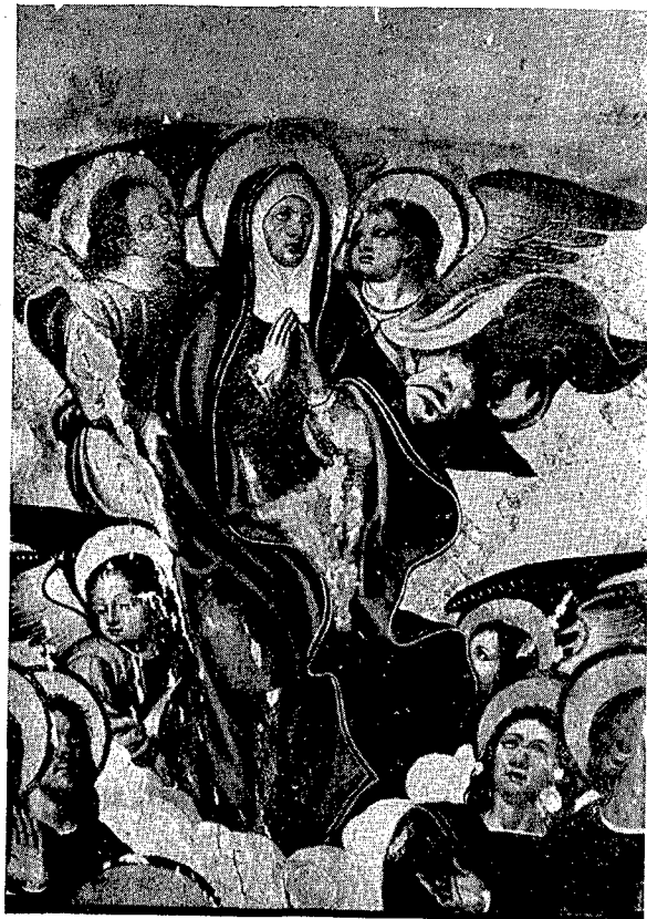
2. Santuario de la «Mare de Déu del Mont». — Detalle de la tabla de la Asunción.