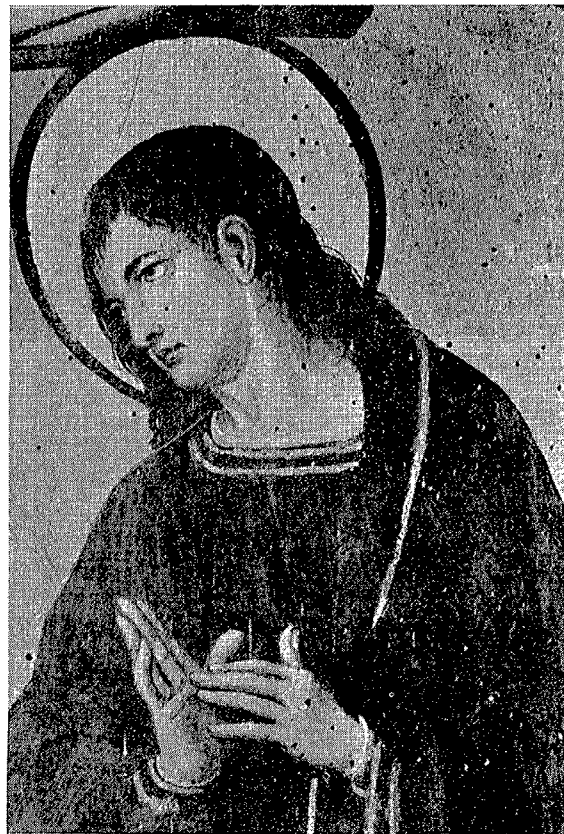
2. San Andrés de Llorona.—El Calvario. Detalle.