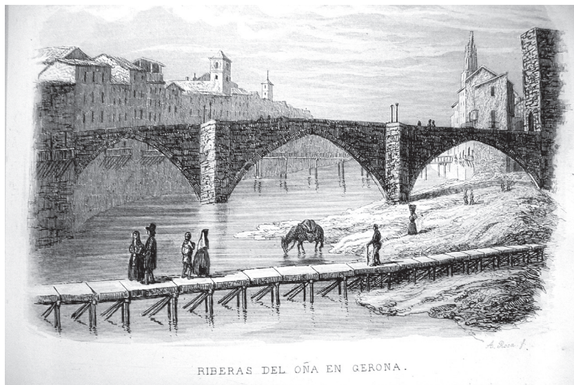
Figura 4. Gravat en què es representa l'Onyar al seu pas per Girona a les primeres dècades del segle XIX, just a tocar del desaparegut pont de Sant Francesc. Durant aquest període Girona era una petita ciutat provinciana i escassament industrialitzada. En conseqüència, les elits polítiques i intel·lectuals estaven formades per eclesiàstics, hisendats i funcionaris de la recentment fundada administració provincial, que compartien un mateix origen social.

un projecte de futur compartit dins d'un estat unitari). 91 És a dir, al contrari d'allò que hom ha afirmat sovint, no eren únicament la resposta d'urgència a un procés desamortitzador que amenaçava el patrimoni històric i artístic del país, sinó que esdevenien una peça més en el nou puzzle administratiu que conformava el naixent estat liberal. 92 Malauradament, els governs liberals no dotaren aquelles Comissions ni de mitjans tècnics, ni econòmics, ni humans per fer la seva feina, de manera que, a la pràctica, només eren unes entitats consultives i honoràries, que assessoraven de forma no vinculant els Govern Civils sobre temes patrimonials. A més, per a més inri, en el millor dels casos, els seus membres eren erudits i col·leccionistes que per amor a l'art tractaven de suplir les seves mancances materials amb grans dosis de bona voluntat; i