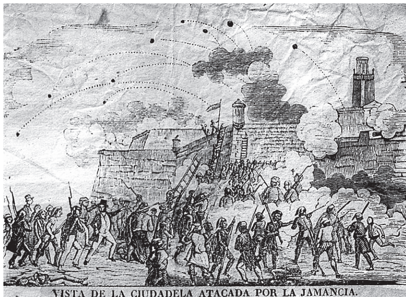
Figura 3: Gravat del segle XIX en què es representa l'atac a la Ciutadella de Barcelona per part de la Jamància. Aquesta fou una revolta de base popular dirigida pels sectors més radicals del liberalisme que, malgrat obtenir alguns èxits inicials, en concentrar-se únicament a Catalunya fou fàcilment esclafada per les forces del Govern Central, que a més comptarem amb la col·laboració inestimable del cabdill progressista Joan Prim.

entrà a la ciutat. En primer lloc, com ja hem vist, hi havia greus dissensions entre els batallons de la Milícia Nacional, la qual cosa afeblia la seva capacitat de resistència. A això, a més, calia afegir-hi la riuada que afectà el barri de Sant Pere la nit del 18 al 19 de setembre, que va provocar la mort d'un bon nombre de veïns i la destrucció de les defenses situades al sector de la porta de França. 59 A més a més, es produí un veritable caos en l'administració local, atès que entre els càrrecs –administratius i polítics–, que foren cessats per les noves autoritats i els que fugiren cap al bàndol contrari –el seu nombre augmentà a mida que quedava clar l'aïllament dels revoltats–, la gestió de la cosa pública esdevenia impossible. Aquest fou el cas de la major part dels