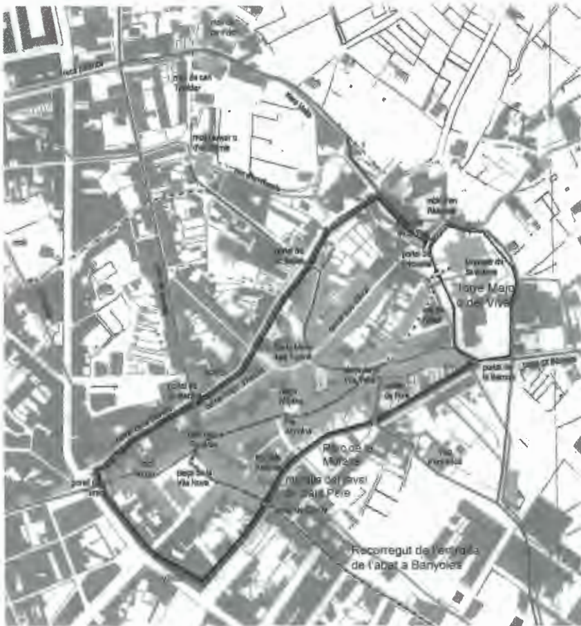
Fig. 1. Plànol del recorregut de l'entrada de l'abat a la vila de Banyoles (plànol J. Moner).

de la muralla urbana. 8 Davant del portal de Girona, avui desaparegut, l'abat baixava de la mula i jurava els privilegis de la vila, després que el jurat en cap li pregués el jurament. El contingut exacte del jurament no es coneix, per manca de documents, però eren ratificats els privilegis, concòrdies i