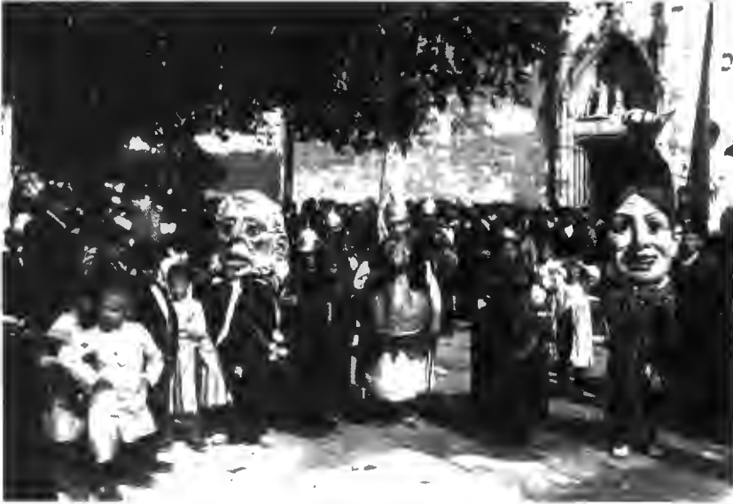
Fig. 3. Els cavallets i cagrossos a l'entrada del monestir de Sant Esteve de Banyoles a principis del segle XX.

La parada següent tingué lloc al portal de Girona, quan la comitiva vingué des de Mata seguint el camí reial. Al peu del portal, el nou abat jurà els privilegis, sentències i concòrdies concedits a la vila de Banyoles: "... y los Rgs. Tornaren á pujar á cavall, y se posaren per son ordre ab lo verguer devant (com si portavan lo talem a las professons) al costat del Sr. Abad, y las demes comitiva anava detras, y luego doná una descarrega de tota la moscateria, y posantse ab lo ordre que havian vingut, sen tornaran a la present vila portant lo Alferes de la Compa. la bandera dels fills de la vila, sonavan los musichs ballavan, los cavallets, y sempre anavan tirant, uns soldats y altres escopetadas, y ab lo degut ordre arribaren en la present vila, y arribat lo Sr. Abad en lo Portal de Gerona, baxaren de cavall los Srs. Rgs. y batlle y se posaren devant lo portal de cara al dit Sr. Abad, y llavors Joan Clayrá secretari digué á dit Sr. Abad lo següent. Molt Ille. Sor. No obstant que lo Ille. Pauli Sala sacristá de la Iglesia Insigne y Collegiata de St Feliu de la ciutat de Gerona Procurador de V. S. ab expres poder age jurat, y firmat tots los Privilegis, Concordias, Consuetuts, Sentensias axi Arbitrals com Judicials, com ja esta Capitulat entre los olims Abads, y convent, y la Universitat de la present vila com consta ab acte rebut en la notaria de la present vila als 14 del corrent mes, y any, ara de nou,