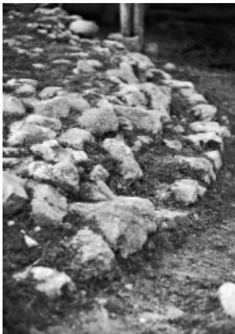
Vestigis de l'absis semicircular. Foto: Miquel Serrano, 2004

Aquesta pot ser una bona interpretació. Tot i així si examinem les compres de terres a prop a Peralada, aquestes, es produeixen des del primer moment. Cal destacar, també, que les vendes de rendes o de masos es comencen a produir, curiosament, el 1333, l'anomenat "lo mal any primer" . És possible que les vendes responguessin a la voluntat d'amortir una època de males collites i crisi