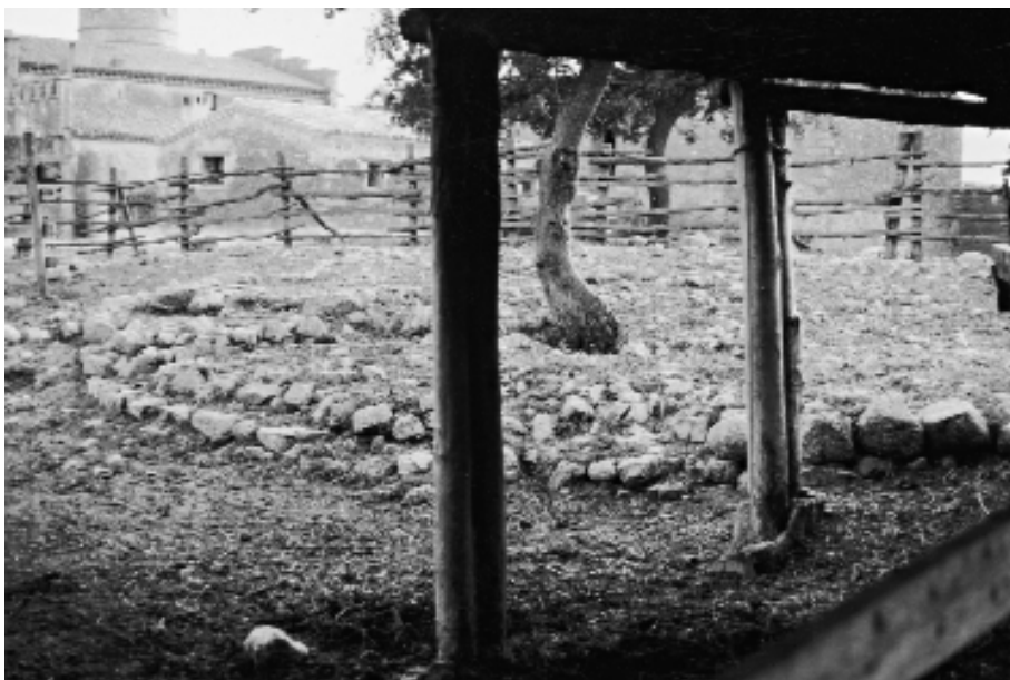
Restes de l'absis del que fou l'església de Sant Bartomeu, 2004.