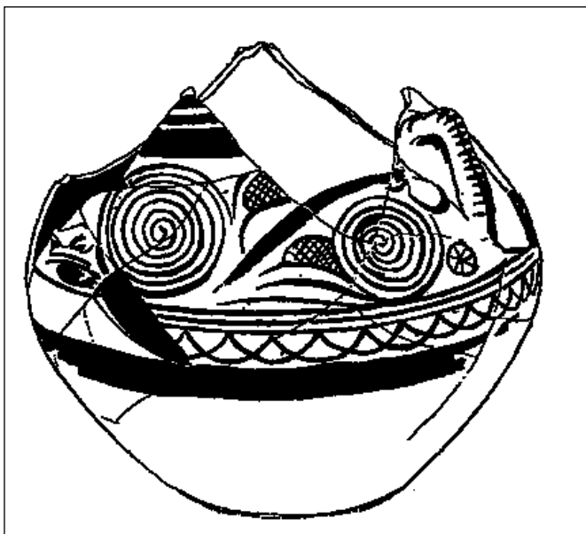
Fig. 1. Dibuix del vas de l'Aigueta publicat per P. Paris a l'AIEC.