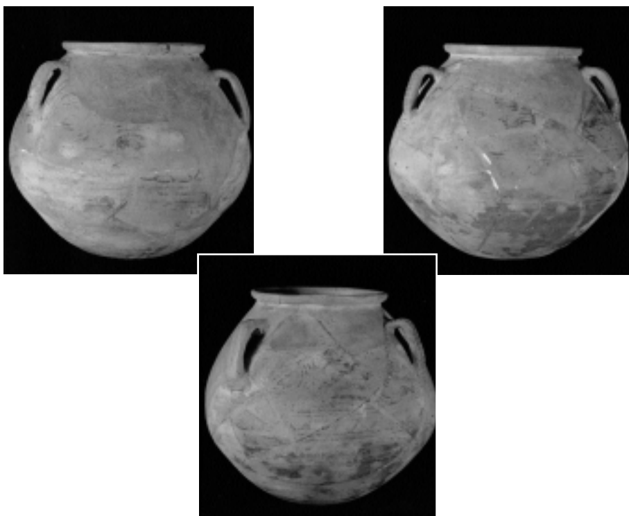
Fig. 3, 1-3. Fotografies actuals del vas de l'Aigueta.

del sud-est de la península, d'Elx i Arxena, entre d'altres jaciments (Bosch Gimpera, 1919, pàg. 257-257).