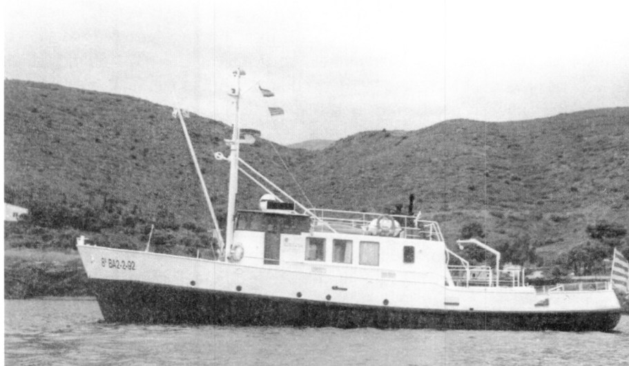
Fig. 4. Imatge del vaixell Thetis.

El diari El Ampurdanés , (13) en la seva edició del dijous 30 d'agost de 1894, donava la següent notícia: “ En el puerto de la Selva, durante los días martes y miércoles de la semana pasada los buzos, pagados por los señores Alfaràs y Pedru, trabajaron en la extracción del fondo del mar de ánforas romanas, hasta el número de 40, algunas en perfecto estado de conservación. Tiempo atrás se había extraído alguna, lo que fue aliciente para dichos señores para continuar los trabajos de investigación ”. (14)