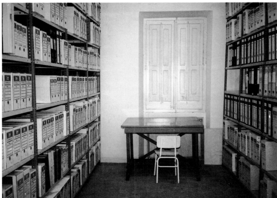
Aspecte que presentava l'Arxiu Municipal després de la seva organització.