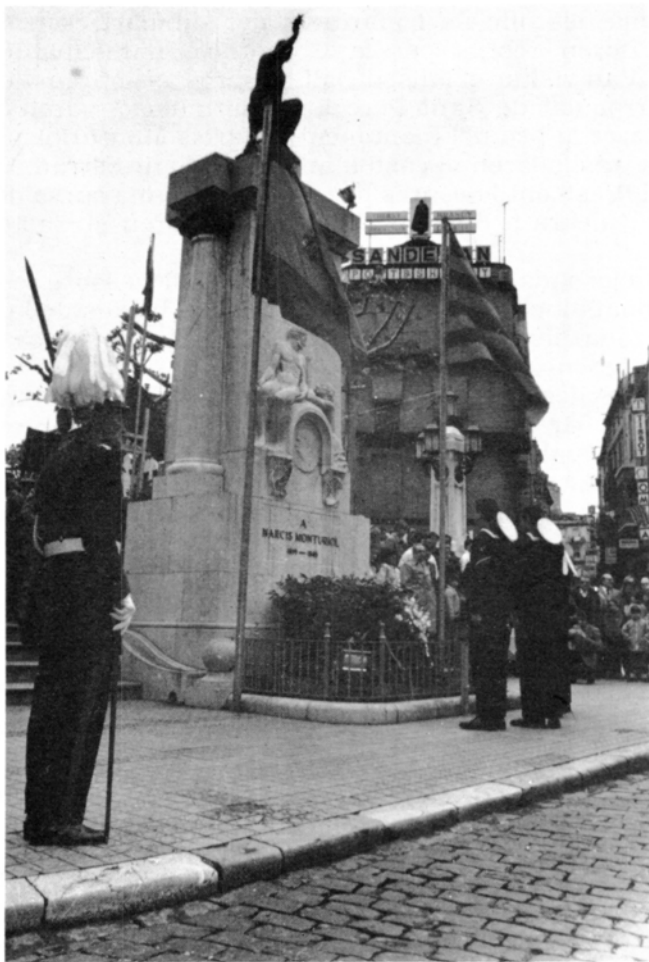
Ofrenda i homenatge davant del monument de l'inventor.

en acción de guerra izásemos esta Bandera, tened por seguro que nos acompañaría el recuerdo de este solemne acto y el ejemplo que en nuestra historia dió siempre la excelentísima ciudad de Figueres».