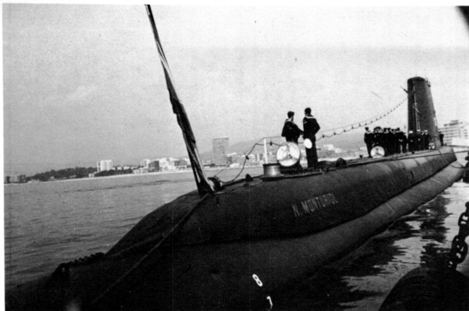
El submarí S-35 varat al moll de Palamós.

submarí S-35, on l'Alcalde de Figueres, Eduard Puig, lliurà una placa en memòria de Narcís Monturiol. Els assistents varen visitar l'interior del submarí i tot seguit, tornaren a Figueres on s'oferí un dinar a les autoritats civils i militars i a la dotació del submarí.