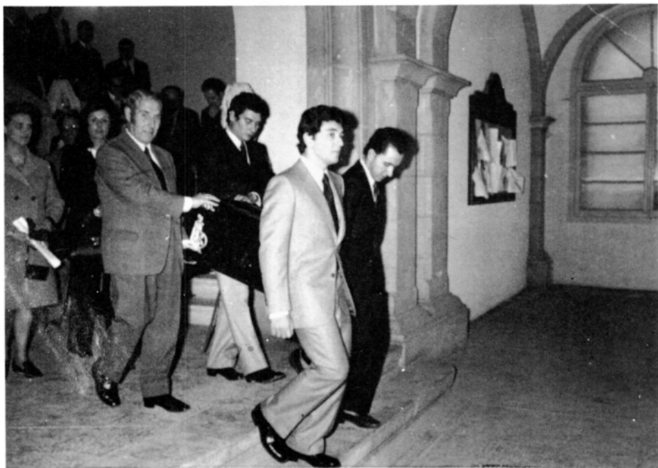
Les restes de Monturiol foren traslladades, pels seus descendents, des de l'Ajuntament al cementiri.

Les explicacions ofertes per l'Alcalde-Corregidor eren que «en vista de las abusivas costumbres que se venían siguiendo, de las diferentes reclamaciones que le habían hecho y la petición de los Sres. Concejales, resolvió no permitir que en lo sucesivo se hiciesen más cuestaciones; que a consecuencia de ésto, el Ayuntamiento acordó dar una cantidad a la cofradía de la Purísima Sangre para suplir el producto de la cuestación que hacía para la manutención de los pobres en la Romería a Recasens y sufragar también los gastos de la comida que según costumbre se da todos los años en los tres días de Carnaval a los presos en las cárceles; que habiendo tenido noticias de que se llevaba a cabo en esta villa una cuestación, sin permiso correspondiente, para la construcción del Ictíneo del Sr. Monturiol, dispuso el referido Sr. Alcalde-corregidor que aquellas cesaran. Que habiendo sido dicho Sr. Monturiol enterado por sus amigos, si bien con inexactitud de dichas disposiciones, puesto que no se le ha denegado por el Sr. Corregidor la facultad de hacer una suscripción voluntaria en todos los puntos que tuviere por conveniente y si de hacer una cuestación, el mismo Sr. Monturiol ha dirigido una comunicación al Presidente de este Ayuntamiento con fecha diez y ocho del mes actual con la que renuncia al Título de Hijo predilecto de esta villa, cuya credencial devuelve».