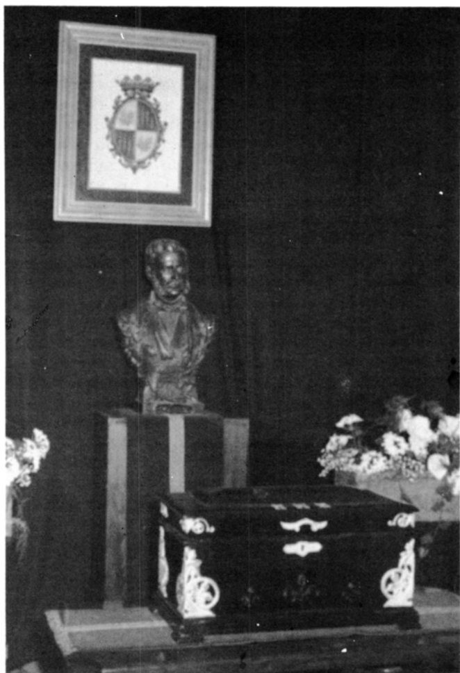
Homenatge a Narcís Monturiol, al Saló de Sessions de l'Ajuntament de Figueres.

Els fets polítics foren en contra de Narcís Monturiol, el seu invent va ésser abandonat i les restes de la nau venudes com a ferralla. Els dos «Ictíneos» de Narcís Monturiol passaven així a la història com la primera nau que navegà sota el mar. Aquest fet el reconeixia el mateix Isacc Peral, a qui la història ha volgut donar el mèrit de la navegació submarina. En data de 18 de febrer de 1889, Isaac Peral escrivia al Club de Regates de Barcelona, des de San Fernando (Cadis) i deia: «Siempre que a un hijo de esa industrial Barcelona me dirijo, no puedo menos de recordar, y recordar con sumo gusto, que catalán era el hombre que dió uno de los pasos más gigantes en la resolución del problema de la