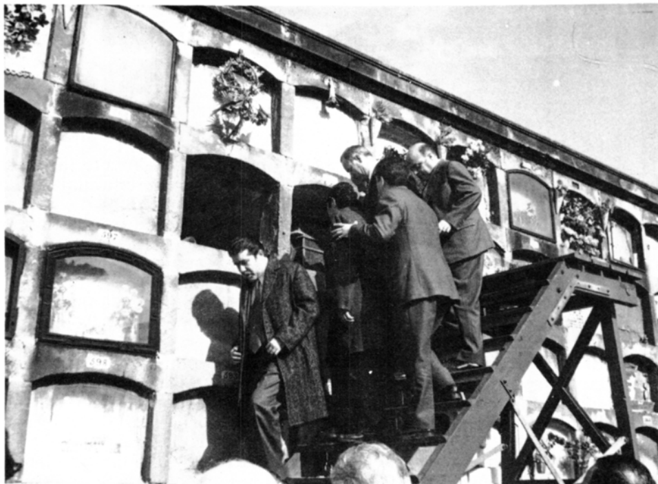
L'any 1972 una comissió de figuerencs foren testimoni de la localització de les despulles de Narcís Monturiol, al Cementiri Est, de Barcelona.

El dia 18 de febrer de 1863, Monturiol signava a Barcelona una carta dirigida a l'Ajuntament de Figueres, on es deia: «Ha llegado a mi noticia, por diferentes conductos, que V.S. no ha permitido la suscripción a domicilio en favor del Ictíneo, noticia que veo confirmada en el número 109 de «El ampurdanés». Este acto que coarta la libertad de los amigos del Ictíneo, libertad de que ha hecho uso en Madrid, Reus y otros puntos; este acto que me priva de mendigar en mi país natal, los auxilios que necesita la navegación submarina, revela pocas simpatías hacia mi empresa, ninguna hacia el que suscribe, y el arrepentimiento de la distinción con que me honró el Municipio en 14 de junio de 1861. Ante un hecho de tanta significación creo debo renunciar y efectivamente Renuncio al título de Hijo predilecto de Figueres, cuya credencial remito adjunta».