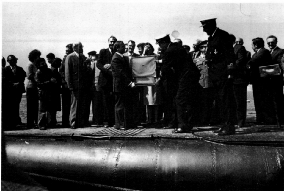
Al moll de Palamós es lliurà una placa al S-35.