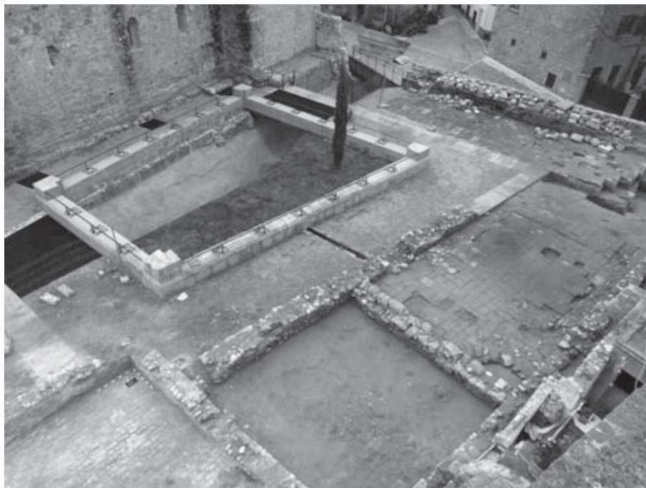
Figura 2. Vista general del claustre. Al refector, s'observen les lloses del paviment ennegrides per l'incendi del segle xv i l'estructura de quart de cercle a l'angle sud-oest.

La singularitat de la construcció del fossat a la banda de migdia rau en el fet que aquesta aprofita l'obra existent –com el mur del podi nord del claustre, que transcorre a dos metres i mig paral·lel a la façana de l'església–, i el combina amb la construcció de nous murs per així guanyar, probablement, temps i esforços. En aquesta banda, el fossat està directament retallat al sòl geològic i presenta una forma de U, amb una disposició, com dèiem, paral·lela a la façana sud de l'església. L'amplada oscil·la entre els 3,5 i els 4,5 metres i la profunditat màxima assoleix els 2,5 metres. No es localitza en la construcció defensiva primigènica una estructura obrada, sinó que tot el vall es troba retallat a les argiles naturals.