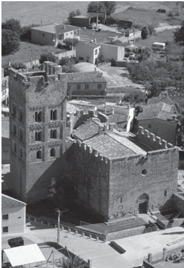
Figura 1. Vista general de l'església en què s'aprecia la fortificació dels murs perimetrals i del coronament del campanar.

És difícil precisar-la també, al nostre entendre, mitjançant només l'anàlisi formal de la poliorcètica, ja que els merlets amb espitlleres motllurades amb totxanes i teula i garfis per als mantellets, presents als murs nord i est de l'església de Sant Miquel, van ser vigents en ambdós segles XIV i XV. 10 Sí que podem, no obstant això, distingir