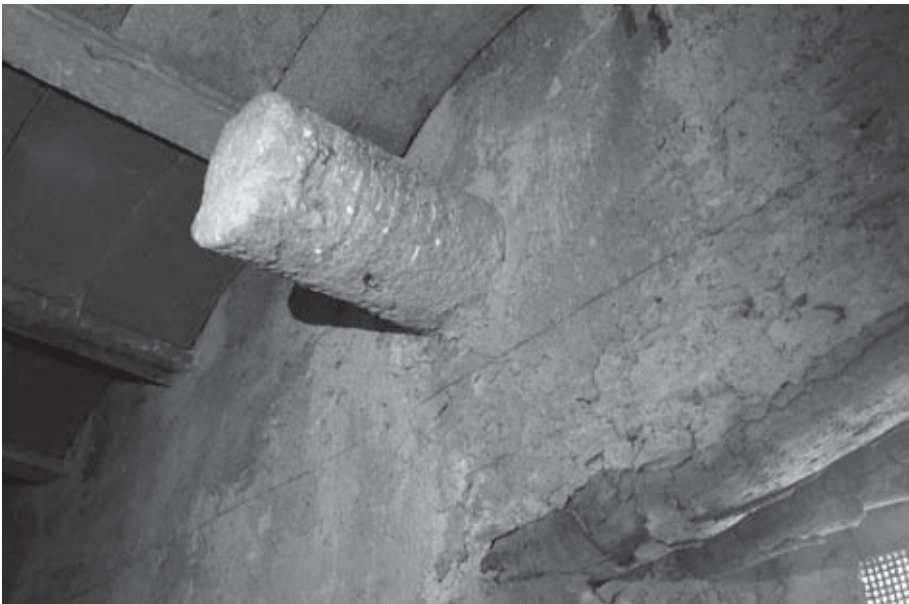
Figura 3. Columna del claustre instal·lada com a permòdol d'una antiga teulada a les golfes nord.

Certs elements trobats a l'àrea claustral semblen indicar que és molt possible que en aquest moment la primera línia defensiva de la banda de migdia del complex se situés en els murs perimetrals del monestir. A l'interior de la fortificació d'aquest costat, per tant, haurien quedat incloses les dependències monàstiques, conservant eixides només les de més al sud, així com les restes del claustre, malmès pel fossat que el travessava i que assegurava un marge arrasat al voltant de l'església. Es tracta d'una configuració del tot lògica des del punt de vista militar: com ja hem vist en el cas de Sant Feliu de Guíxols, deixar a l'abast de l'enemic edificacions massa