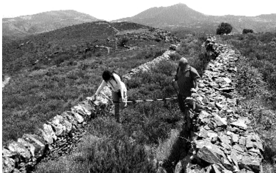
Carrerada del coll de Sant Genís (Ipsa Via –collum sancti Genesii–).

S'identifica amb el nom documentat com Ipsa Via (collum sancti Genesii) , via que va cap al coll de Sant Genís des de l'est (zona de Perafita i Cadaqués). Igual que la carrerada del Port de la Selva, el camí del coll de Sant