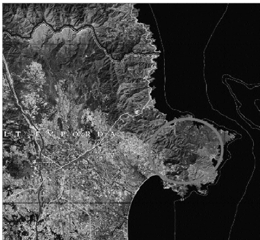
Situació de l'àrea d'estudi (base cartogràfica: ICC).

època de l'any, han fet que hàgim pogut prospectar només una part, si bé els resultats han estat del tot positius, ja que han permès, d'una banda, documentat diversos jaciments inèdits i d'altra banda comprovar l'estat actual d'altres ja coneguts.