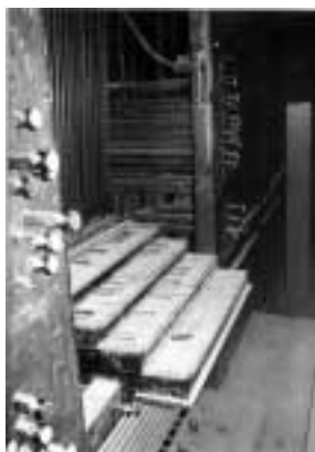
Consola després de la guerra civil (quatre teclats destruïts).