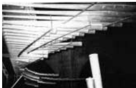
Llengüeteria de batalla (trompeteria).

Una cara: la façana. Aquesta és la part decorativa de l'instrument. Està situada en el lloc més visible i està composta generalment per una gran caixa que emmarca diverses agrupacions de tubs en seccions i altituds proporcionades i disposats a diverses alçades. Cada instrument presenta una fisonomia pròpia que permet, generalment, detallar la seva estructura i riquesa interiors i/o l'època de la seva construcció. Els tubs del flautat major o principal, com a joc fonamental, solen col·locar-se a la façana de l'orgue en posició vertical. Altres jocs, com la llengüeteria de batalla, es col·loca horitzontal a la façana.