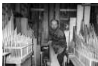
Imatges de l'última fase de restauració.

Es va dur a terme l'elaboració i la instal·lació de la mecànica de notes i els registres corresponents. La disposició del pedal ara és: flautat 16'.