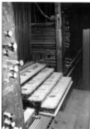
Estat dels teclats després de la guerra.