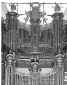
El mirall que permetia veure el mossèn.