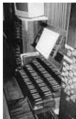
Consola actual amb quatre teclats (posada l'any 2000).