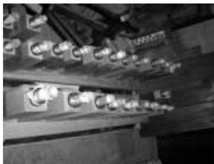
Els secrets abans de ser col·locats a l'orgue.