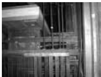
Manxa actual en repòs.