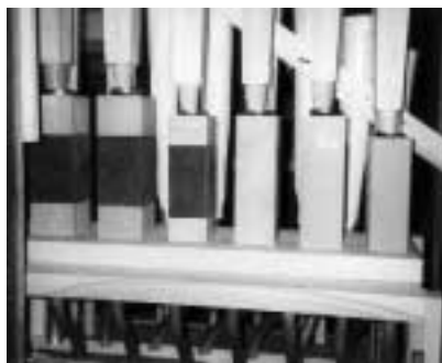
Els secrets nous ja col·locats en el seu emplaçament.

de pressió per mitjà d'una vàlvula que és accionada per una tecla. Uns forats practicats a sobre de la caixa de canals sostenen els tubs. Per aquests forats, que posen els tubs en comunicació amb els canals, resten obturats mentre no s'estira un registre. Cada registre està connectat a una “corredera”, o sigui un llistó de fusta amb una fila de forats que coincideixen amb els forats de la tapa de la caixa de canals i controla un joc de l'orgue. Les correderes són mòbils: llisquen de forma que, quan s'estira un registre, els forats de la corredera coincideixen amb els de la caixa de canals i permeten que, en baixar les tecles i obrir-se les corresponents vàlvules, entri l'aire en els tubs i soni.