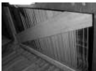
Fotografia del pedaler actual (acoblat a l'orgue major).