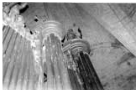
Tubs del flautat major o principal.

L'orgue de Castelló es va construir en una època en la qual l'ornamentació de la façana havia experimentat un procés d'embelliment: es pintava primorosament la fusta de la caixa, s'embellia amb figures de músics, d'àngels, etc.