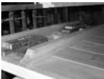
Pesos sobre la manxa per regular la pressió de l'aire.

Un sistema respiratori i circuladori de l'aire: la manxa, els portavents i els salmers o secrets. Tots aquests elements constitueixen un conjunt de pulmons que, alimentats per una manxa, nodreixen i reparteixen l'aire a la pressió i quantitat necessàries per a l'alimentació dels tubs, col·locats sobre el salmer de cada cos de l'orgue.