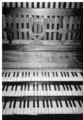
Consola amb tres teclats des del 1981 fins a l'any 2000.