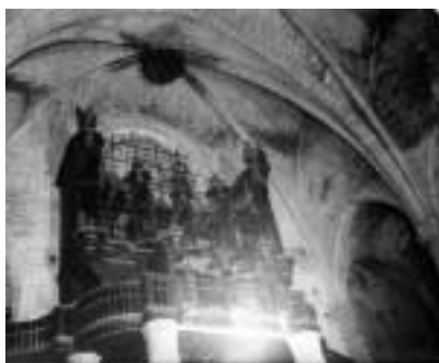
Com es pot observar en la fotografia, durant la guerra es van endur tots els tubs de metall, però la mecànica va quedar sencera.

El coro desaparecido. Órgano con graves desperfectos, de imposible reparación. Retablos quemados. El armonium con muchos desperfectos.