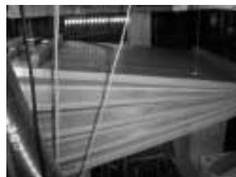
Manxa actual en funcionament.