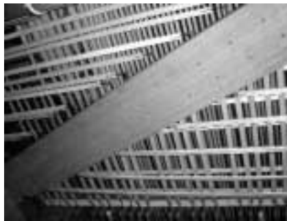
Traccions dels diferents teclats.

to i el timbre prèviament determinats en funció del registre (3) o registres escollits i de les tecles polsades.