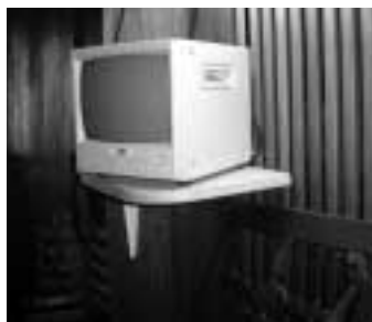
Fotografia de la pantalla.