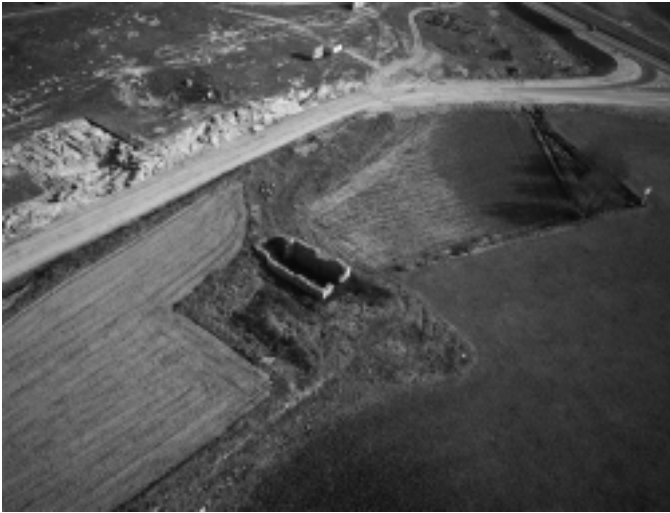
Vista general de l'església de Santa Margarida i del seu entorn, a tocar l'actual carretera que mena a Sant Martí d'Empúries.