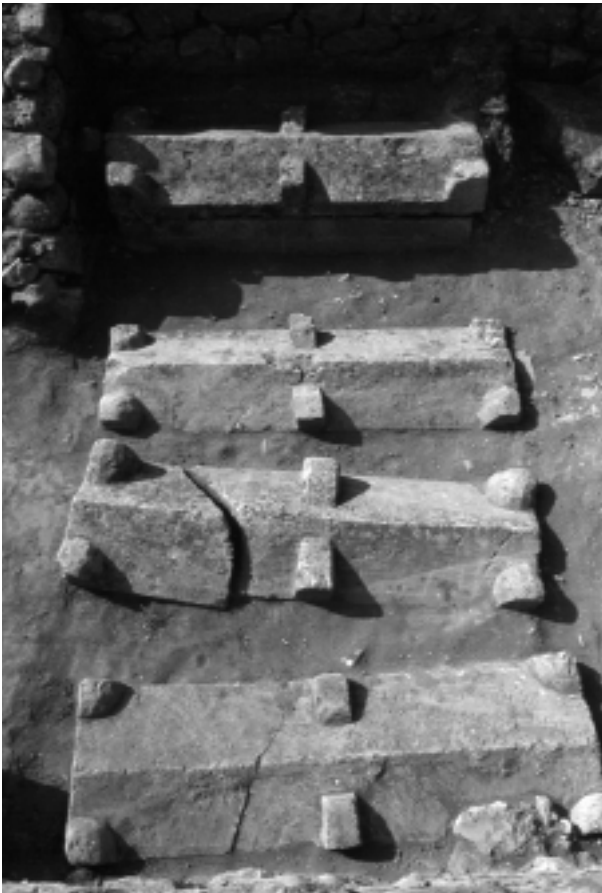
Sarcòfags disposats a l'interior d'una cambra funerària que formava part de l'àrea de la cella memoriae de la Neàpolis d'Empúries.

El panorama funerari, per aquest període, és ben conegut, gràcies especialment als treballs de J.M. Nolla i J. Sagrera (1996). Sens dubte, la necròpoli més important és la necròpoli ubicada damunt de les restes urbanes del sector septentrional de la Neàpolis grega. Amb gairebé 500 tombes documentades, de tipologia diversa i de cronologies que abracen des del segle IV fins al final de l'antiguitat tardana, aquesta necròpoli va ser, sens dubte, la necròpoli urbana de la ciutat d'Empúries, reduïda al nucli de Sant Martí. El cementiri s'articula al voltant d'una petita cella memoriae que, posteriorment, és convertida en una església funerària i a la que s'adossen diferents cambres funeràries amb els enterraments més sumptuosos, principalment en sarcòfags de pedra amb coberta també de pedra de doble vessant i acroteris. És precisament d'aquesta zona d'on provenen els dos magnífics sarcòfags esculpturats d'època romana amb representacions del cicle de les estacions, un localitzat l'any 1846 i l'altre l'any 1908. Junt a aquest cementiri principal, es localitzen diverses àrees