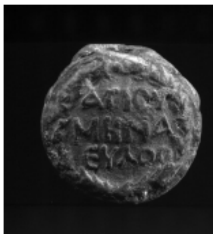
Anvers i revers d'una ampulla de Sant Menes, originària del santuari egipci dedicat a aquest sant, que duïen els pelegrins. S'hi representa el sant entre dos camells i la llegenda en caràcters grecs.

oferia la zona i facilitar les activitats econòmiques (agrícoles i ramaderes) del grup humà instal·lat (Aquilué, Castanyer, Tremoleda, Santos 2004). Amb la mateixa tipologia d'habitació, cal relacionar les estructures localitzades a les excavacions efectuades l'any 1991 amb motiu de l'adequació de la carretera de Sant Martí d'Empúries, prop de l'església de Santa Margarida. Damunt d'una zona d'enterraments d'època altimperial, s'adequa la zona al segle IV en un lloc per emmagatzematge de gra, que resta amortitzada, entre mitjan segle IV i mitjan segle V, per una necròpolis d'inhumació. A partir del segon quart del segle VI es constata una fase constructiva de certa envergadura que converteix el sector en una zona d'hàbitat, que va perdurar fins a finals del segle VII o posterior (Llinàs 1997, 149-169). Sens dubte, aquesta zona d'hàbitat presenta les mateixes característiques que la del carrer del Museu, 1.