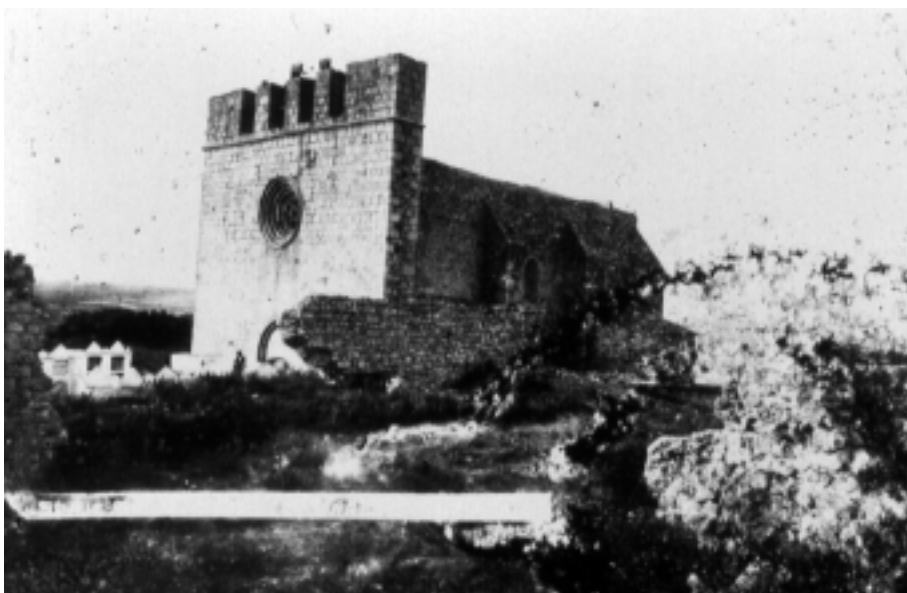
Imatge que oferia l'església de Sant Martí d'Empúries, encara amb l'antic cementiri al costat.