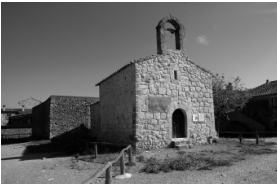
Aspecte actual de la capella de Santa Reparada de Cinclaus, una vegada finalitzada la seva excavació i restauració.