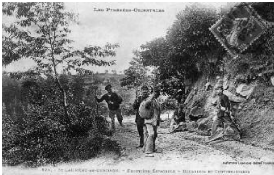
Escenificació d'una detenció d'uns contrabandistes per part de duaners francesos a Sant Llorenç de Cerdans.