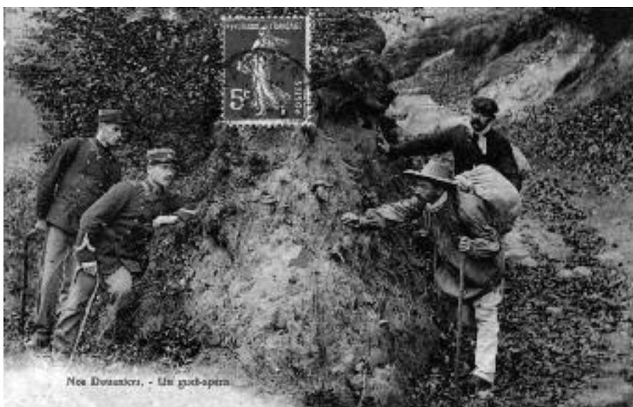
Una emboscada. Escenificació "d'un d'aquells conflictes entre contrabandistes i duaners que s'esdevenen quotidianament a la frontera".