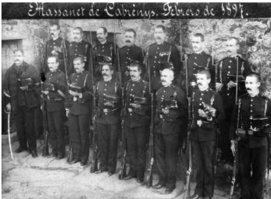
Companyia de carrabiners de Maçanet de Cabrenys. Fotografia del febrer de l'any 1897.

este incidente, a fin de que tomándolo en consideración se reclame del Gobierno francés una medida que corte de una vez el atrevimiento de unas gentes tan perversas y atrevidas". De orden de S.A. comunicada por el expresado Sr. Ministro lo traslado a V.E. para los efectos convenientes en el Ministerio de su cargo, acompañándolo la copia del parte que se cita. Dios guarde a V.E. muchos años. Madrid 9 de Julio de 1841".