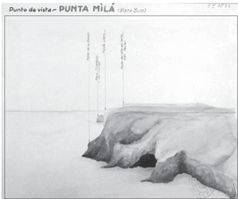
Il·lustració de punta Milà feta pel Regiment d'Artilleria Núm. 20. AIMP.