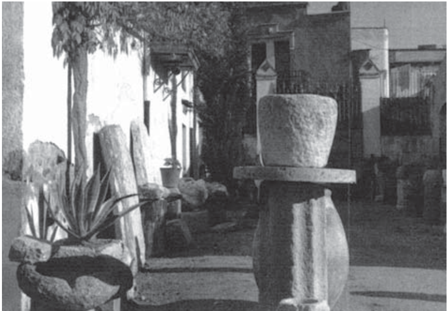
Figura 4. Fotografia de Tomàs Casadevall, veí de Vilajuïga, de l'entrada del Museum Margineda a inicis dels anys 60 del segle XX. Una de les dues lloses –o totes dues– estintolades a la paret del museu podrien ser el tros conservat de la coberta de la Vinya d'en Berta.

...Y algo más que entristece, que abruma, sólo con pensarlo: ¿Qué ocurrirá con el Museum Margineda cuando desaparezca su meritísimo fundador? ¿Tendremos que ver dispersada esta colección de un ilustre ampurdanés? Dios no lo quiera”.