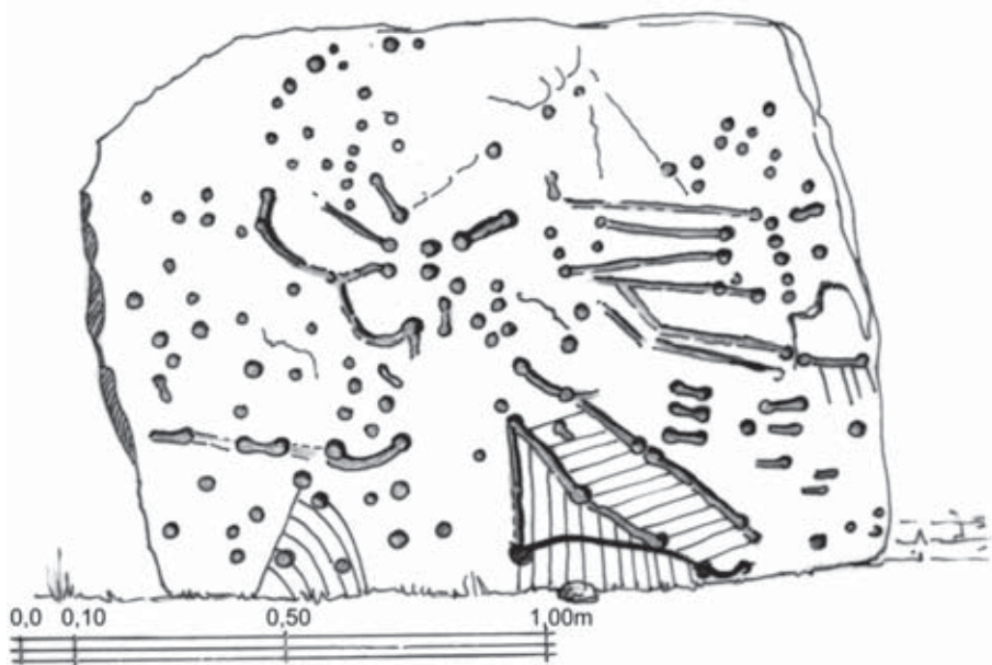
Figura 5. Dibuix per Benjamí Bofarull Gallofré del fragment de coberta decorat amb cassoletes, reguerons i gravats en espina de peix de la cista amb túmul de la Vinya d'en Berta a partir de la fotografia original de Manuel Genovart.

Però ara, aquestes noves decoracions ratllades o en espina de peix que hem constatat sobre la seva coberta ens situen de cop en un escenari molt