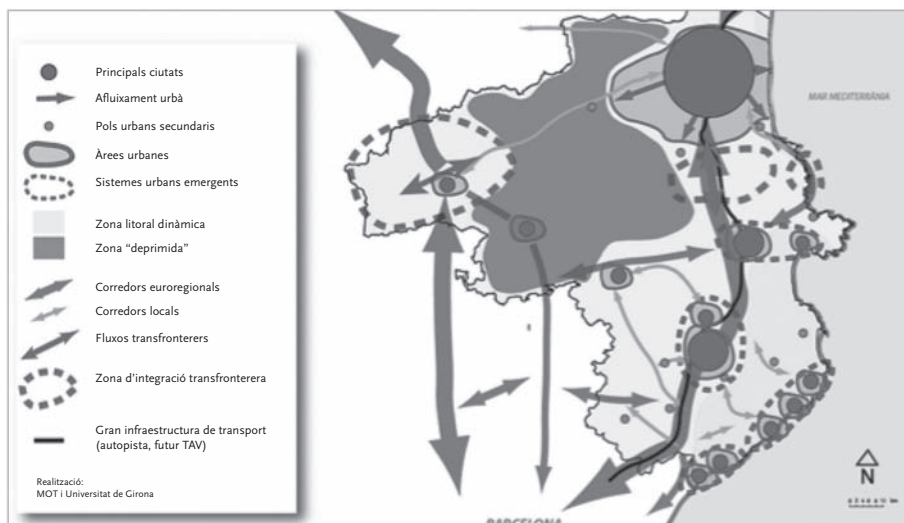
Figura 1. Esquema del funcionament territorial de l'Espai Català Transfronterer.

Figueres té un important rol territorial. Rol marcat per la seva situació geogràfica privilegiada, a un pas de la frontera francesa, en el corredor natural nord-sud, però també com a punt d'unió entre aquest i l'eix est-oest paral·lel als Pirineus fins al mar Mediterrani (figura 1). Forma part del conjunt de ciutats mitjanes que estructuren el conjunt del territori català, fora de l'àrea metropolitana de Barcelona.