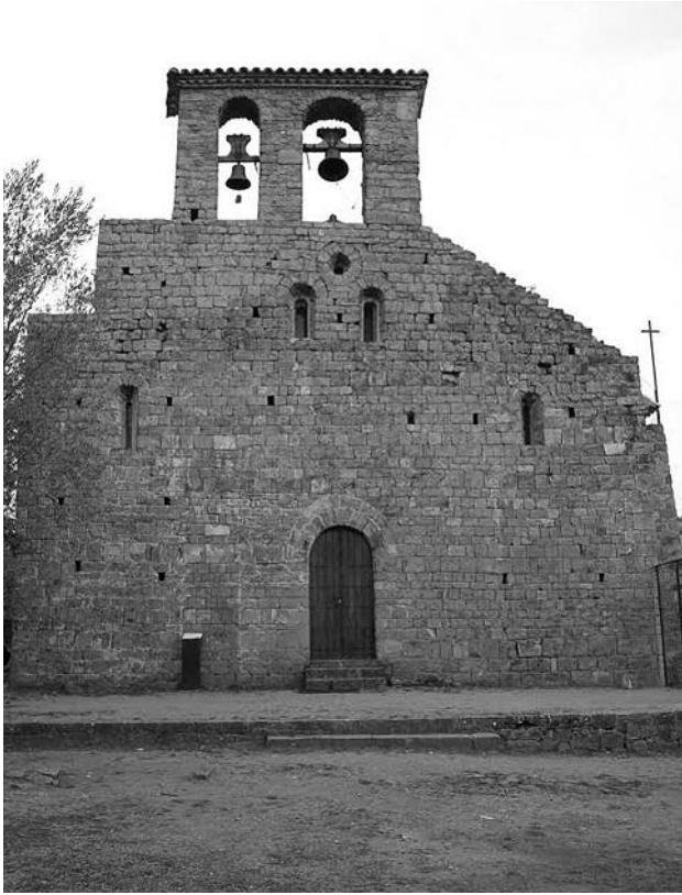
Figura 6. Sant Sepulcre de Palera.

“Concedimus etiam predictae Ecclesie ex parte Dei omnipotentis & beate marie Virginis & beati Petri Apostoli & omnium sactorum talem libertatem ut quicumque illic causa orationis venerit & de sue proprietate vel substantia predictae Ecclesie dederit accepta peccatorum confessione ac penitentia ex malis retro ante comisis talis ei merces a Domino recompensetur sicut in sepulcro Domini nostri Jesuchristi Jherosolimitani” (33)