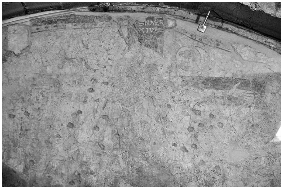
Figura 3. Pintura mural amb escena de Calvari del claustre inferior de Sant Pere de Rodes.

la creu, amb les figures del sol i la lluna a ambdues bandes del creuer. Aquesta és precisament la mateixa iconografia detectada en l'encolpium que s'ha descrit anteriorment. Al costat de la creu, a l'esquerra, hi ha la figura de Sant Joan. També s'hi pot apreciar la silueta d'una altra creu amb la figura de Dimas, el bon lladre, mentre que a la part inferior hi ha les figures dels soldats Longinos i Stephaton amb les seves llances. Si bé la datació d'aquesta pintura ha generat una certa controvèrsia, s'accepta amb més o menys discrepàncies una datació del segle XI, (18) i és molt probable que s'hagi de situar en el darrer quart.