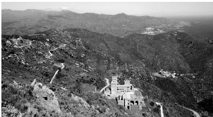
Figura 1. Monestir de Sant Pere de Rodes.

octavis, quandocumque in die veneris venerit in mense madii, ipso die et supradictis octavis sequentibus, causa devotionis accesserint vel elemosinas ergaverint de omnipotentis Dei misericordia et beatorum apostolorum Petri et Pauli eius auctoritate confici, omnium vere penitentibus et confessis penitentiis sibi immunitis penam atque culpam misericorditer relaxamus” (8)