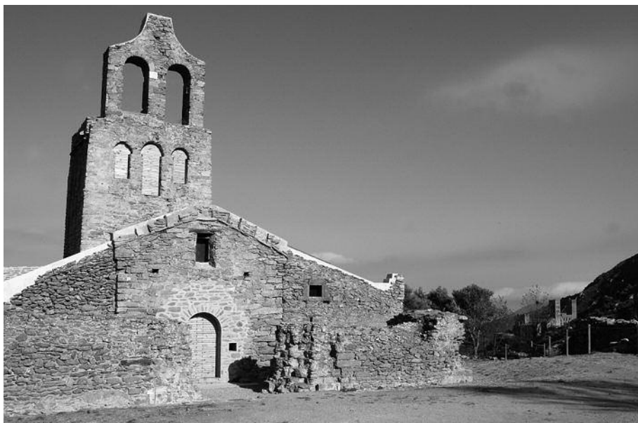
Figura 5. Església de Santa Helena de Rodes.

Totes les creacions artístiques que s'acaben de descriure porten a la identificació d'un escenari propici per a la devoció de la Santa Creu, almenys durant els segles XI i XII. A tot això cal afegir encara que en el context més immediat al monestir es detecten alguns indicis que fan pensar en la viabilitat de situar en aquest indret un centre neuràlgic d'aquesta devoció en els territoris del comtat d'Empúries. En concret, cal observar certes advocacions en l'entorn més proper que estan directament relacionades amb aquest culte. En primer lloc, la de l'església de Santa Helena de Rodes (figura 5) del poblat de la Santa Creu, situat a poca distància del monestir, topònim que ja ens indica un clar arrelament d'aquesta advocació. L'ocupació del poblat de la Santa Creu fins a ple segle XV s'ha pogut documentar de manera bastant precisa, com a resultat de la campanya d'excavacions duta a terme a partir del 2006. (24) I encara resulta més