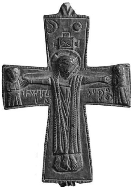
Figura 2. Encolpium procedent de Sant Pere de Rodes (Museu d'Art de Girona).

En primer lloc, cal fer referència a un encolpium procedent de Sant Pere de Rodes que actualment es conserva al Museu d'Art de Girona (figura 2). Aquest és un dels objectes que formaven part del conegut com a "tresor" de Sant Pere de Rodes, descobert arran d'unes prospeccions al monestir l'any 1810. (14) Es tracta d'una magnífica obra d'orfebreria repussada i cisellada, que hom ha datat entre els segles VI-VIII. (15) A l'anvers, apareix una escena de Calvari, amb la figura de Jesús crucificat a la creu, que presenta els símbols de la lluna i el sol al braç horitzontal, i les figures de Maria i Sant Joan als