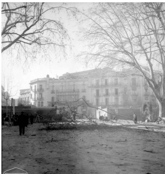
Fotografia de la Guerra Civil Espanyola d'Albert Louis Deschamps (Rambla de Figueres amb refugi al fons, 1939).