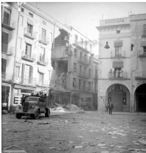
Fotografia de la Guerra Civil Espanyola d'Albert Louis Deschamps (placa de l'Ajuntament de Figueres, 1939).

Les armes nazis i feixistes arribaven volant directament o per via marítima a través del col·laborador Portugal. (7)