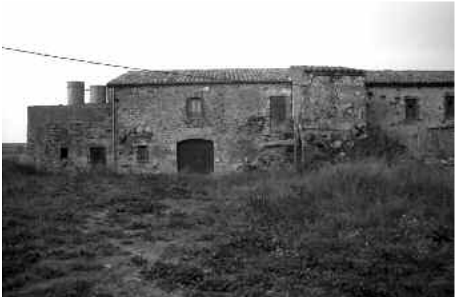
Figura 1. L'actual mas Xirivilla.

El monestir de Sant Miquel Sescloses s'hauria situat a uns dos quilòmetres al nord-est de l'antiga capital del comtat d'Empúries, en les immediacions de l'antiga església parroquial de Sant Joan, a tocar de l'estany de Castelló i al costat del camí que anava de Castelló cap a Pedret i Pau. Malgrat que diversos historiadors han dubtat de la seva situació exacta, Salvador Famoso ens va confirmar definitivament la seva ubicació, corroborada per diverses referències documentals coetànies que refereixen la seva situació. Així, el 1365 una terra d'1,5 vessanes apareix situada " iuxta monasterii Sancti Michaelis de Crosis, infra parrochia Sancti Johannis que afronta ab oriente in carraria publica... ", (5) i indica la seva proximitat al camí. Altres documents situen el monestir entre la capella de Sant Joan Sescloses, l'estany de Castelló i la via pública esmentada, i permeten confirmar que el priorat s'hauria construït al turó on avui es troba el cortal Xirivilla (Fig. 1),