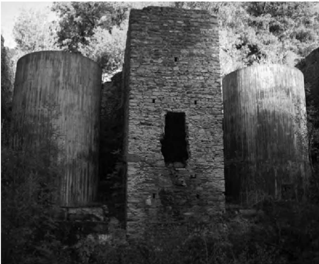
Estació del funicular, prop del Pont de Castellars.

PRAT DE LA RIBERA (0.806367, 42.415928):