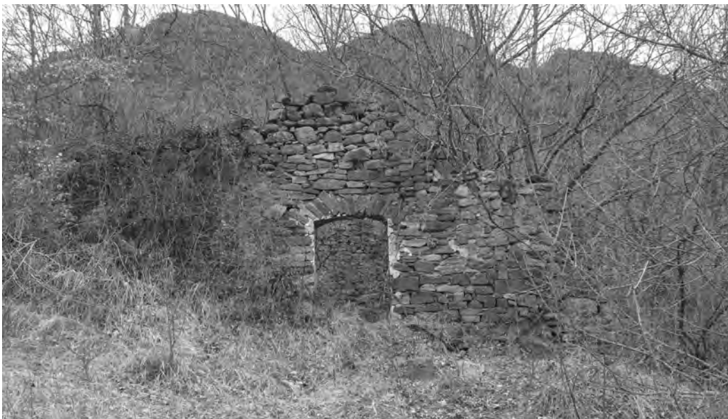
Borda del Viudo.

D. És interessant remarcar que algunes cases de pobles com ara Erillcastell o Peranera tenen bordes a la ribera.