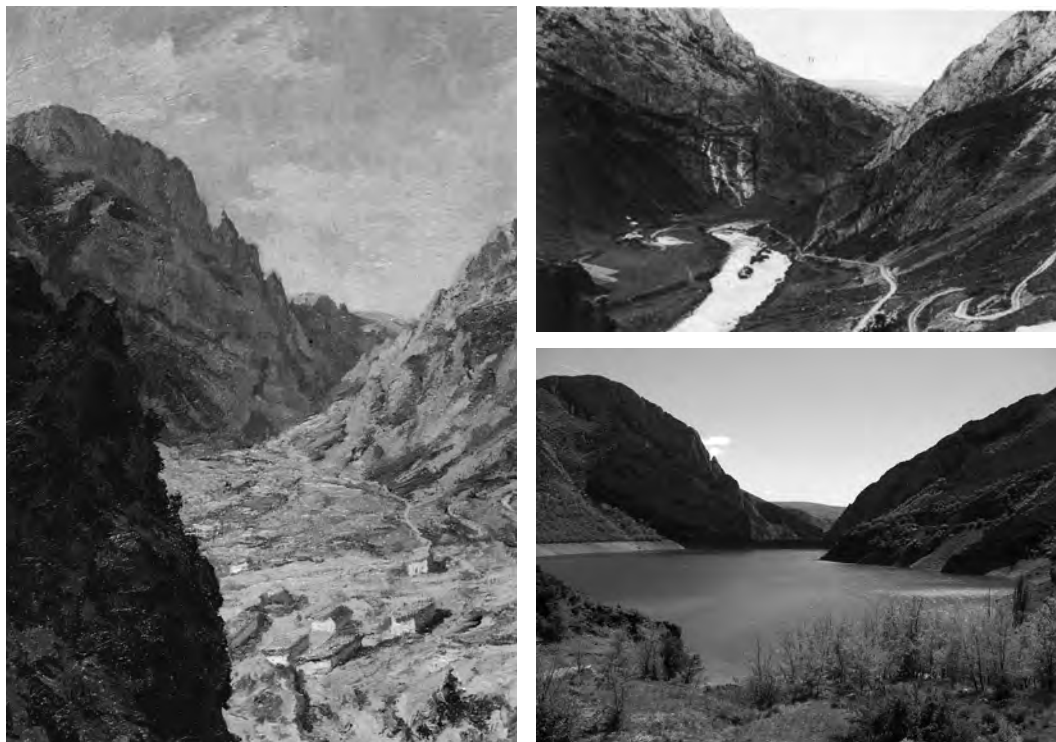
FIGURA 1: Escales, un paisatge extingit. A l'esquerra: Escales, de Joan Subirà. A la dreta, una imatge dels anys 1940, abans de la construcció de la resclosa (a dalt) i una altra d'actual (a baix).

«Ribagorça–Sopeira», de mossèn Antoni Navarro, demostra la vinculació amb les lectures de paisatge d'origen aliè a la realitat local: els versos s'hi tornen a concentrar a la vall principal a l'alçada del Pas d'Escales: