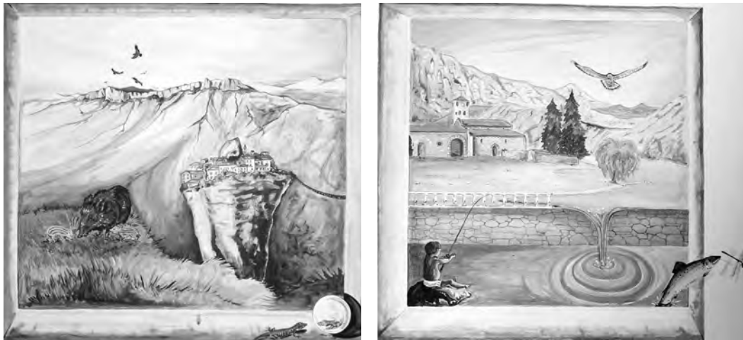
FIGURA 4: El paisatge idealitzat de la Terreta a través de tècniques pictòriques. Esquerra: «Espluga de Serra». Dreta: «Sopeira».

seva vida a activitats relacionades amb l'artesanía, la pintura o l'escultura. Nosaltres n'hem trobat un exemple prou il·lustratiu, que ens suggereix algunes reflexions. Es tracta d'una sèrie de pintures (frescos, perquè estan pintades directament sobre parets) realitzades per l'autor holandès Maaïke de Klerk, que des de fa més d'una dècada viu a Espluga de Serra (terme municipal de Tremp). Els frescos van ser un encàrrec d'un empresari d'hostaleria d'Areny (de fet, estan pintats a les diferents estances de l'edifici). Aquest fet és transcendent per comprendre el contingut de les imatges: es tracta de paisatges de la Terreta plens d'elements de ficció, fàcilment identificables, però amb un vessant oníric que mostra la marca de l'artista (el qual, d'altra banda, no sol realitzar aquest tipus d'obres i, si ho ha fet —segons les seves declaracions— fou per desig exprés del propietari del negoci).