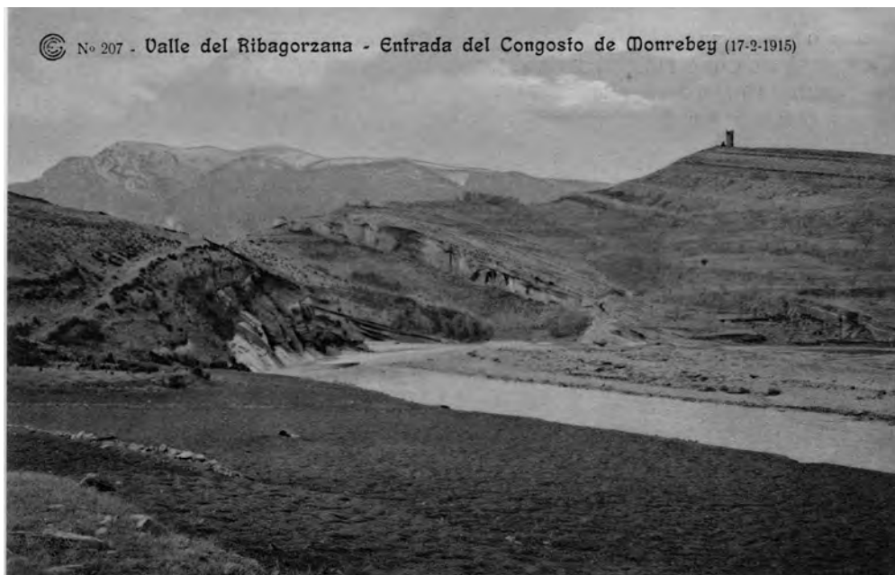
FIGURA 2: La Noguera Ribagorçana, a punt d'endinsar-se al congost de Montrebei, en una fotografia de 1915.

La finalització de les obres d'ENHER a la Terreta (que culminaren amb la inauguració de la central del Pont de Montanyana el 1959) deixà al descobert que els efectes positius que havia tingut la presència de l'empresa durant deu anys foren només un episodi aïllat, incapaç d'aturar el procés de desertització demogràfica que ja havia començat a inicis del segle xx. Un cop més, la divisòria entre l'alta i la baixa Ribagorça donava els seus fruits, reforçant la