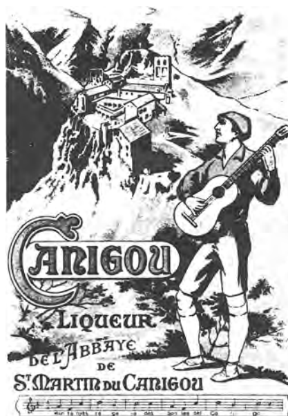
Anunci del licor Canigou, principis del segle XX.

En el procés de descoberta de la muntanya, el primer pas va ser treure-la de l'indicible, perquè, com diu Mazzotti, 90 no per molt gran que sigui una muntanya estem obligats a veure-la. A Catalunya, en poc més de tres-cents anys, la muntanya va deixar de ser indicible i va entrar a formar part de l'univers ecosimbòlic d'alguns grups socials. Finalment, ja era pertinent de parlar-ne.