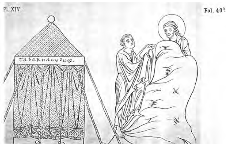
Gravat de l' Hortus deliciarum , d'Herrad de Landsberg, segle XII. En aquesta escena, el mont Sinai és representat com si es tractés d'una pedra.

Així mateix, des del segle XIII la muntanya havia substituït el desert per representar les escenes de la Tebaida, de manera que, progressivament, els ermitans havien anat ocupant un lloc menor en la pintura, i l'escena profana havia passat a ocupar-ne la major part. Finalment el sant acabarà per esborrar-se en un procés que donarà naixement a la pintura de paisatge moderna. 66