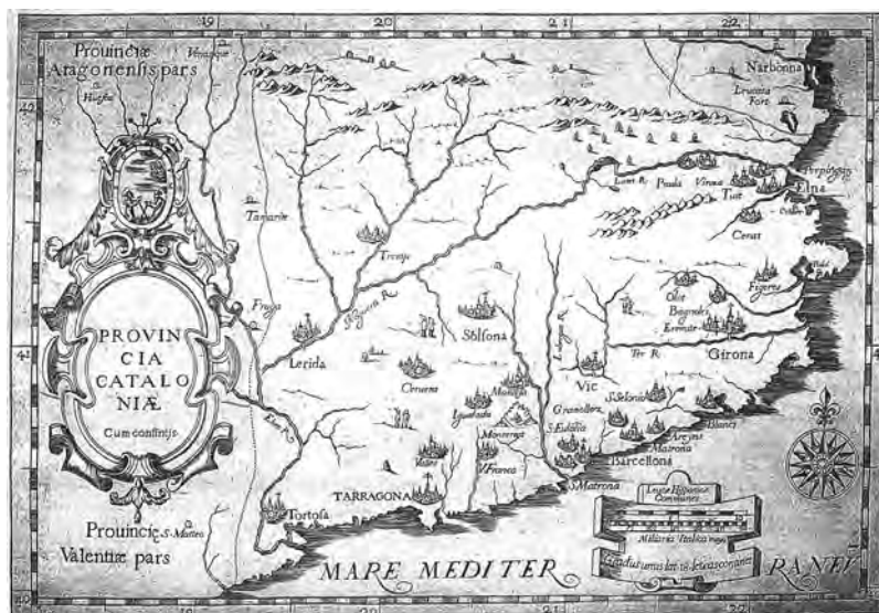
Mapa Provincia Cataloniae cum confinijis , de B. Burdigalensis, L. A. M. Regali i M. a. Guchen, 1643. Vegeu-hi la importància que adquireix la muntanya de Montserrat.

d'altitud va aparèixer en francès a la fi del segle XVIII, i el mot al segle següent. 6 Fins llavors, el món occidental hauria tingut una percepció qualitativa de la realitat. 7 Això explica també que fins al segle XVIII els cartògrafs tinguessin problemes per representar les muntanyes, raó per la qual donaven molta més importància a la hidrografia. 8 La invenció del baròmetre el 1643, que va ser utilitzat per Pascal l'any 1647 per mesurar el Puy de Dôme, 9 va tenir un valor transcendental perquè feia possible descriure amb exactitud matemàtica l'altura. D'aquesta manera, a casa nostra, amb l'arribada del segle XIX, ja es començarà a identificar muntanya amb verticalitat. 10