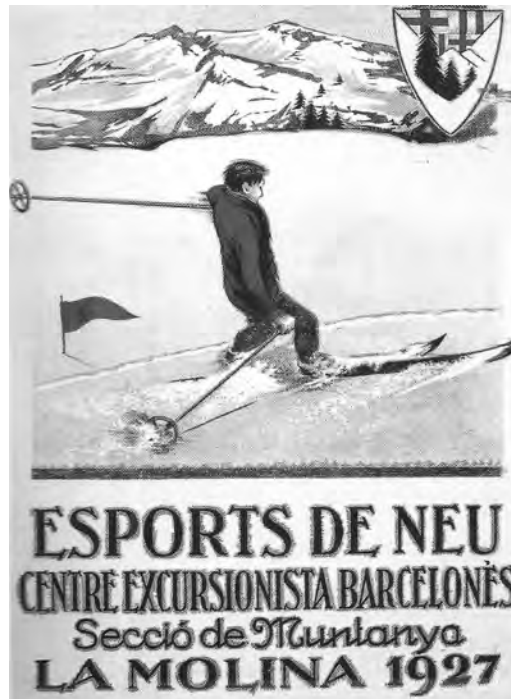
Cartell del concurs d'esports de neu organitzat pel Centre Excursionista Barcelonès, 1927.

L'aportació excursionista és important, sobretot, pel fet que va esdevenir, en bona part, la imatge que després es va popularitzar a través de les pràctiques turístiques. L'any 1915, Manel Folch i Torres deia que havia arribat el moment que els sindicats d'iniciativa (les entitats de promoció del turisme) «posin en valor allò que les societats excursionistes han descobert i conservat, ho propaguin i ho donin a conèixer». 63 Formalitzades pels excursionistes, les pràctiques turístiques acabaran popularitzant les noves imatges de