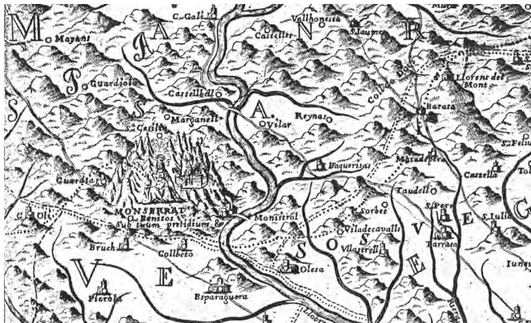
Nueva Descripción Geographica del Principado de Cataluña , de J. Aparici, 1720. Detall de la part en què apareix Montserrat.

El cas de Montserrat demostra que, en un món tan marcadament catòlic com l'Espanya de la Contrareforma, existien els elements necessaris perquè algunes montanyes esdevinguessin belles. La montanya , doncs, estava preparada per esdevenir un conjunt de fets