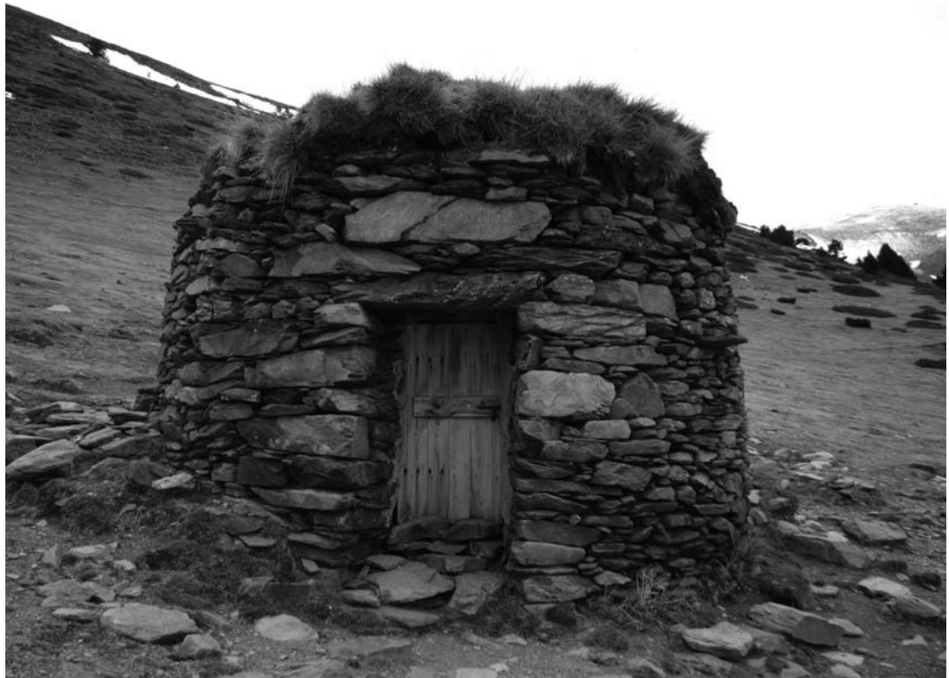
Barraca de planta rodona amb llinda plana i sostre aplevat. (Fotografia: tècnics del CEINR)

Tota la recerca realitzada en el marc d'aquest estudi permet afirmar que les construccions de pedra al Ripollès tenen una gran riquesa arquitectònica —que a continuació s'explica amb més detall—, en tant que tenen semblances amb diverses construccions tant del propi Pirineu com d'altres indrets situats més al sud, com poden ser les construccions de pedra seca del Baix Penedès. Això sembla lògic si es té en compte l'existència de la transhumància: