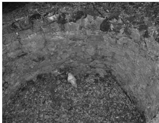
Teuleria a Vallfogona de Ripollès.