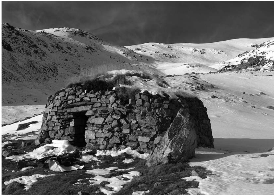
Una barraca de pastor típica de l'alta muntanya del Ripollès.

Però no només es tracta de les barraques de pastors. El patrimoni humà dels boscos, prats i pastures del Ripollès va més enllà, i a les valls, a les terres baixes, es transformen en aixoplucs i construccions de pedra lligades als horts, a les feines d'artiga i a l'agricultura en general. Aquestes construccions de la terra baixa montana, amb usos molt diferents de les barraques de pastor de l'alta muntanya, també formen part d'aquest patrimoni humà que va quedant envaït pels boscos que avancen inexorablement.