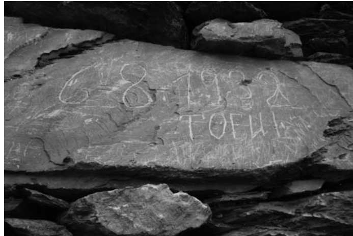
Gravats trobats en una de les barraques.