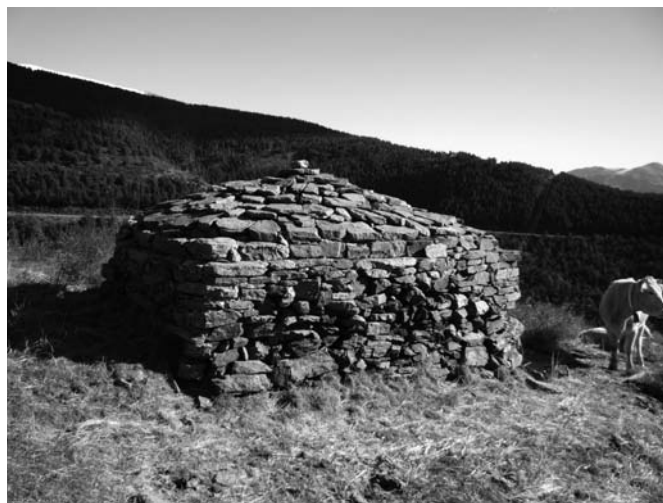
Barraca de planta rectangular i sostre continu a les parets.

Pel que fa a les cobertes, se'n troben amb coberta de pedra, molt poques, i la gran majoria tenen terra aglevada, també perquè es tracta d'elements constructius que tenen continuïtat amb parets de pedra seca i/o el propi desnivell del terreny.