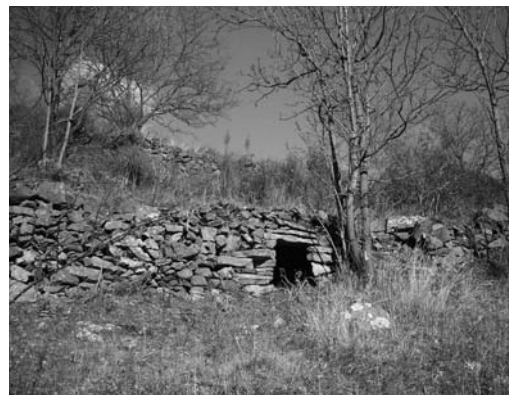
Diverses tipologies de cabanes i aixoplucs. (Fotografia: tècnics del CEINR)