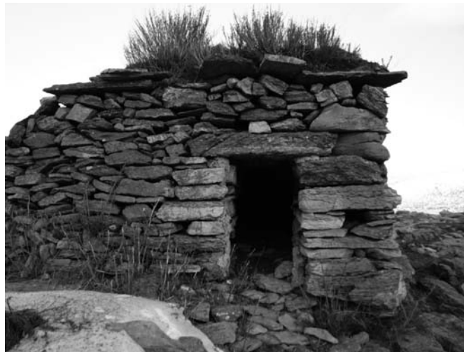
Barraca de planta rectangular amb llinda plana i sostre de lloses.

La tipologia de les barraques, cabanes i aixoplucs que s'han localitzat és molt variada, en funció de l'ús i la localització a l'alta muntanya, als boscos o prats de les valls. Pel que fa a les plantes, n'hi ha de rodones, com la que s'ha posat a tall d'exemple en la fotografia, però també de planta quadrada o rectangular.