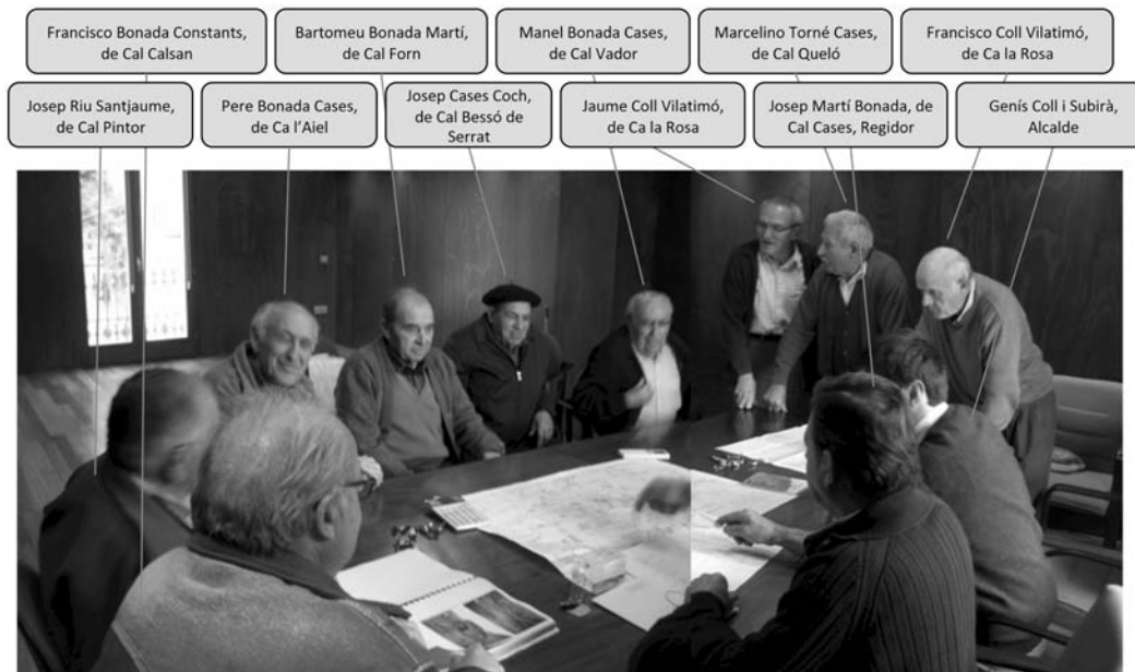
Els pastors de Queralbs.