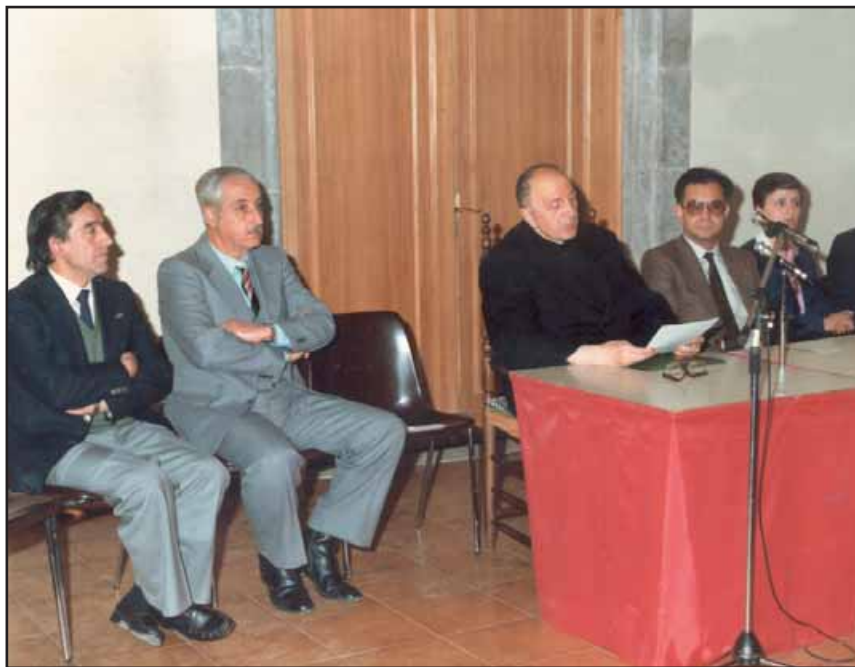
Pregó de Sant Eudald. Sala Abat Senjust, 1 de maig de 1983