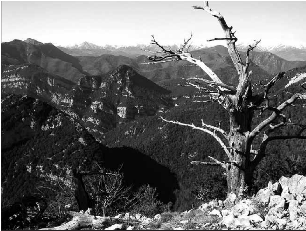
Orografia de la zona vista des del cim del Bassegoda. Consorci de l'Alta Garrotxa.

canvi sense moviment de diners. Com en d'altres ocasions, en les activitats que estan al límit o fora de la llei els prejudicis deixen pas a la pràctica. Creiem que, per l'indubtable interès dels testimonis recollits, tant el contraban com el maquis són dues temàtiques que haurien de ser estudiades a través dels testimonis orals, perquè són fenòmens molt recordats pels habitants de l'Alta Garrotxa (d'edats avui ja ben avançades) durant la postguerra, en especial als anys 40 i 50.