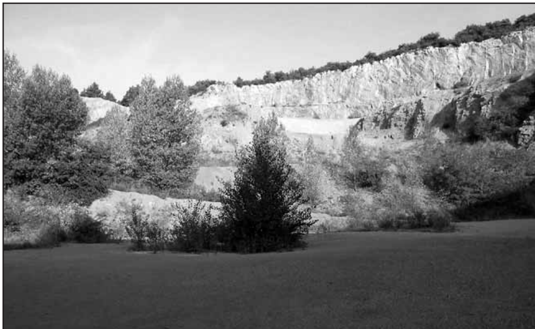
Traginers de l'Alta Garrotxa. Centre Excursionista de Banyoles.