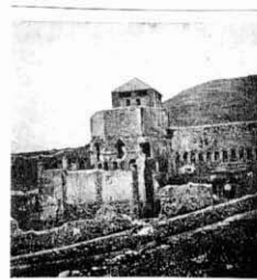
Abat del Monestir d. Santa Maria de Ripoll, abans de la restauració.