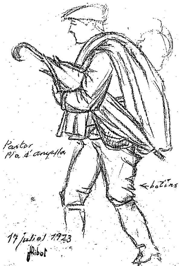
Pastor al pla d'Anyella. 17 de juliol de 1923