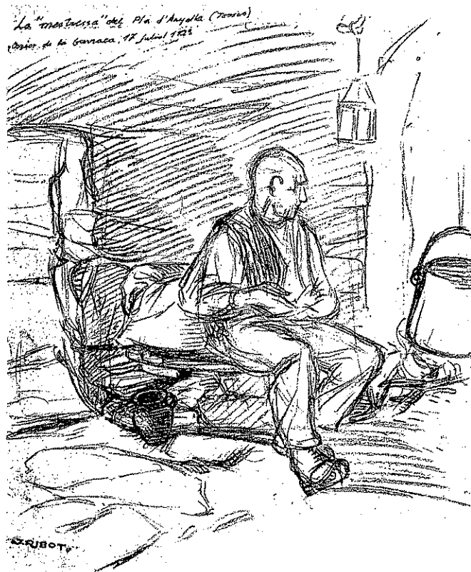
La “mestressa” del pla d’Anyella (Toses) a l’interior de la barraca. 17 de juliol de 1923