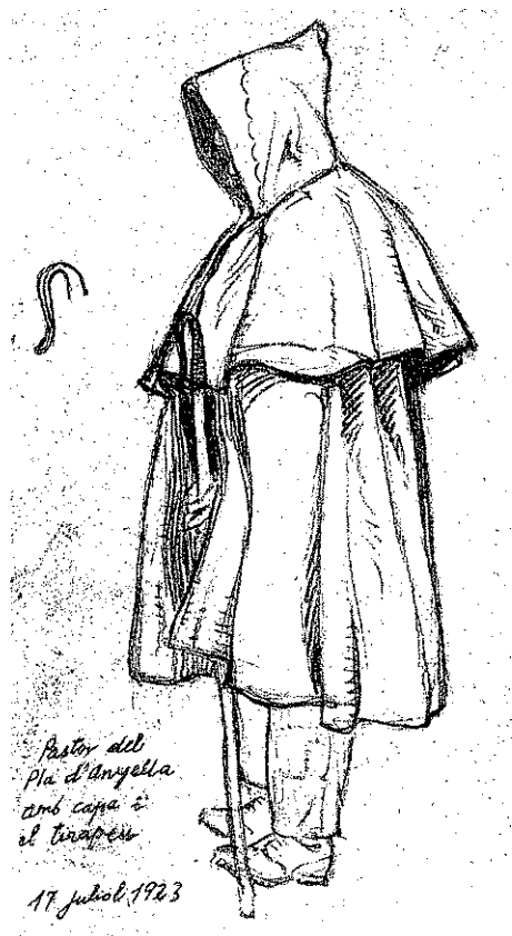
Pastor del pla d'Anyella amb capa i el tirapeu. 17 de juliol de 1923