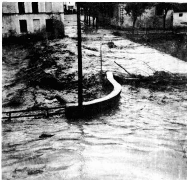
Les aigües del Ter en el moment de sobrepassar el pont d'Olot.