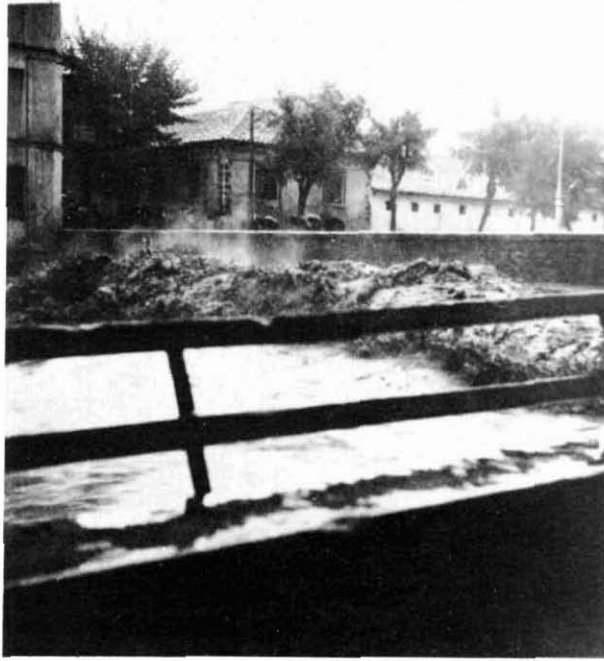
El riu a les dotze del matí. La gent ja no travessava el pont.

totes les centrals elèctriques fins a Vic, destruïdes. A Montesquiu, 50 llars en perill de ruïna i la fàbrica "Carburos de Calcio", destrossada. La Farga de Bebié tampoc no es deslliurà de l'embat fluvial: l'edifici de la fonda i pisos confrontants, les escoles, els murs de contenció del canal i les botigues properes, el pont d'enllaç i les passarel·les de servei de la mateixa factoria i la de pas cap a la colònia... tot desaparegut.