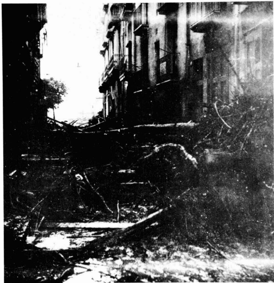
El carrer de mossèn Cinto, el dia següent.

Vull manifestar el meu agraïment al Sr. Eudald Graells, el qual –a part de ser l'autor de les fotografies– em narrà de viva veu l'inesborrable record que serva d'aquelles jornades. També dono les gràcies als Srs. Birba, de Camprodon; Busquets, de Ribes de Freser; Pujol, de Sant Quirze de Besora; a M. Mercader, de Sant Joan de les Abadesses, i a totes les persones que han ajudat en la corroboració de les dades.