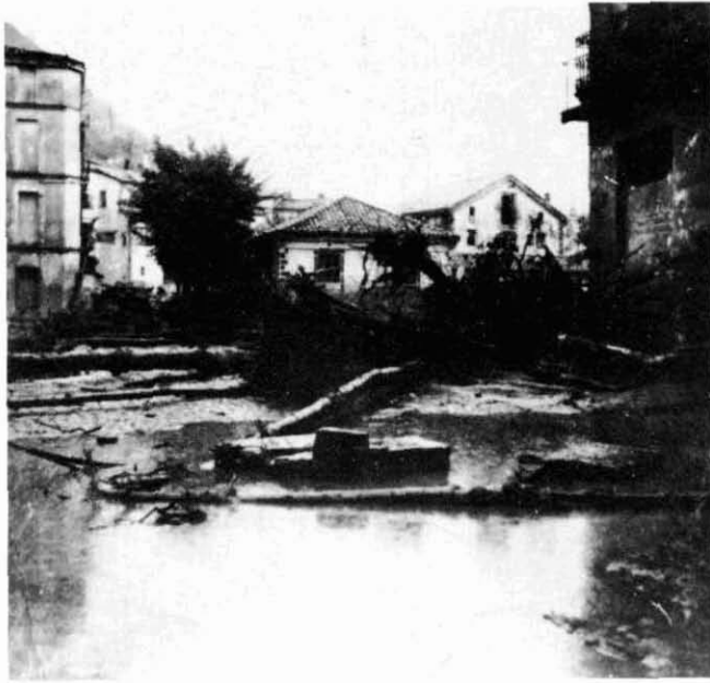
El pont d'Olot, l'endemà de l'aiguat.

Pal (o de Fogonella) i l'al·luvió l'enderrocà totalment. Força de les explotacions de carbó de Surroca s'estropellaren i un dels minaires estigué a punt de sucumbir.