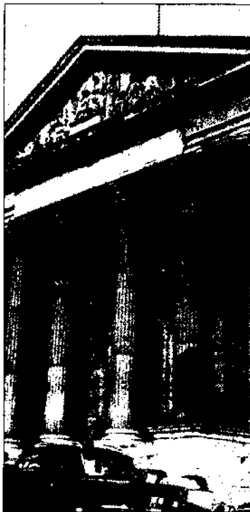
El palacio del Congreso de los Diputados. Desde un grupo de hombres armados se ha hecho fuego y refugio a los parlamentarios y miembros del Gobierno.

El Gobierno y el Parlamento, rehenes de un grupo de guardias civiles