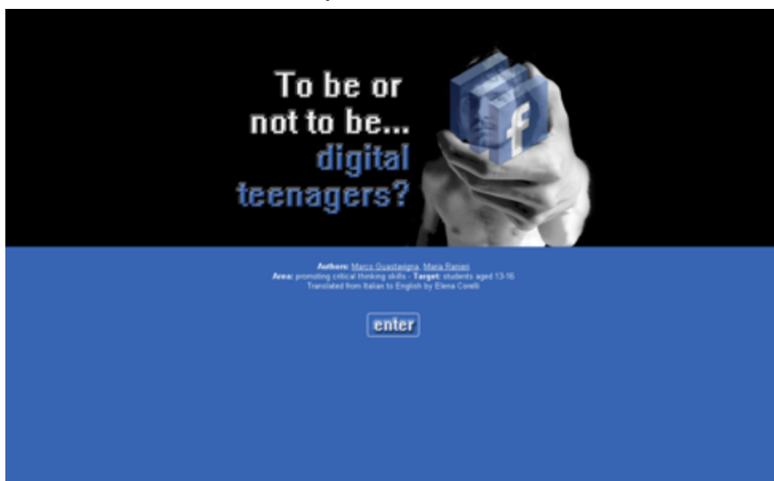
FIGURA NÚM. 2 - PÁGINA PRINCIPAL DE “¿SER O NO SER... ADOLESCENTES DIGITALES?”

Por otra parte, el módulo educativo tiene también como objetivo el promover la creatividad de los estudiantes y su capacidad para crear productos digitales de acuerdo con sus propias lengua y gramática. El enfoque en los distintos medios se basa en una aproximación transversal a la cuestión de la comunicación digital.