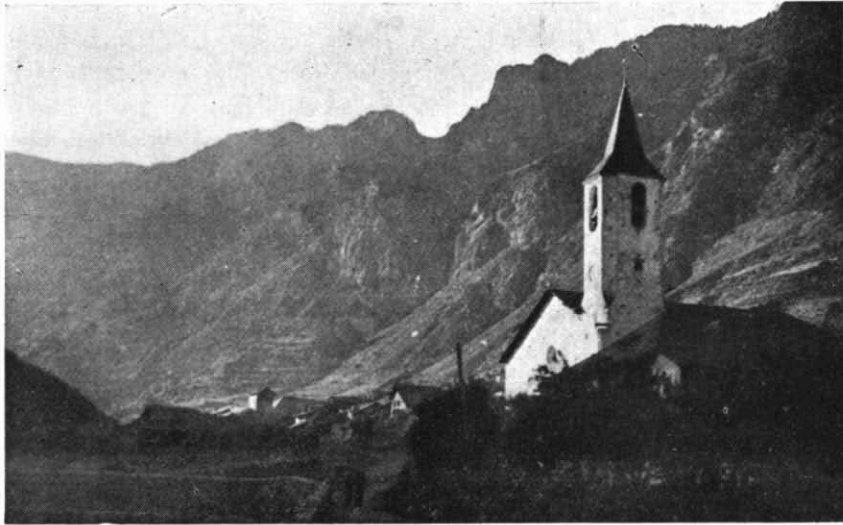
Pueblo y Valle de Espot

De madrugada salimos de Espot. Empezamos en seguida a remontar el valle por la senda forestal que conduce al lago de San Mauricio, siguiendo siempre la orilla derecha de la Riera Escrita.