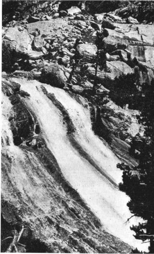
Cascada del rio Tor, cerca del Lago de Cavallers

Sucesivamente advierto la presencia de Rhammus Frangula L., Lonicera pyrenaica L., L. Xylosteum (n. v.: cornera borda , en Boí).