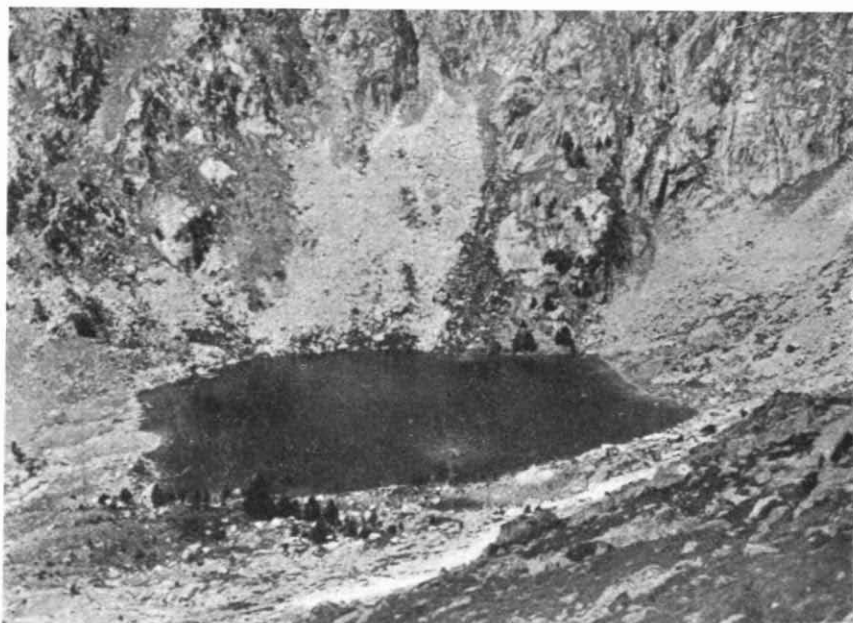
El «Estany Rodó»

La brechina ( Calluna vulgaris Salisb.) se aventura aún por estos parajes, consiguiendo rebasar los 2.450 m. de altitud. En la cumbre del puerto hallamos: Jasione perennis Lamk., Thymus nervosus Gay, Eryngium Bourgati Gouan, Anthyllis montana L., Globularia cordifolia Lamk., Sempervivum montanum L., algunas almohadillas de Juniperus nana Willd., y entre otras muchas plantas, varias gramíneas