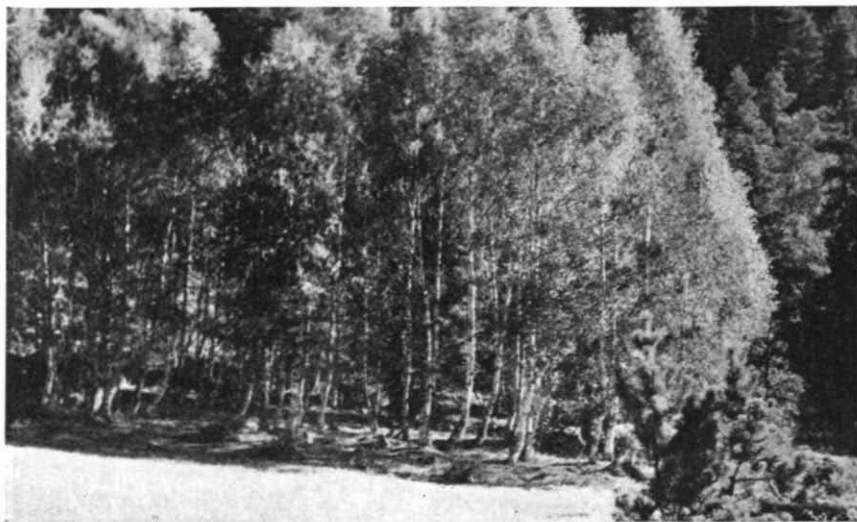
La grácil silueta de un bosque de abedules, cercano al Pont de Espallers

Nos permitimos un breve alto en el camino, para tomar aliento, junto a la ermita de San Mauricio. Prosiguiendo el camino, nos hallamos, en cuatro zanjadas más, a la orilla N. del lago de San Mauricio