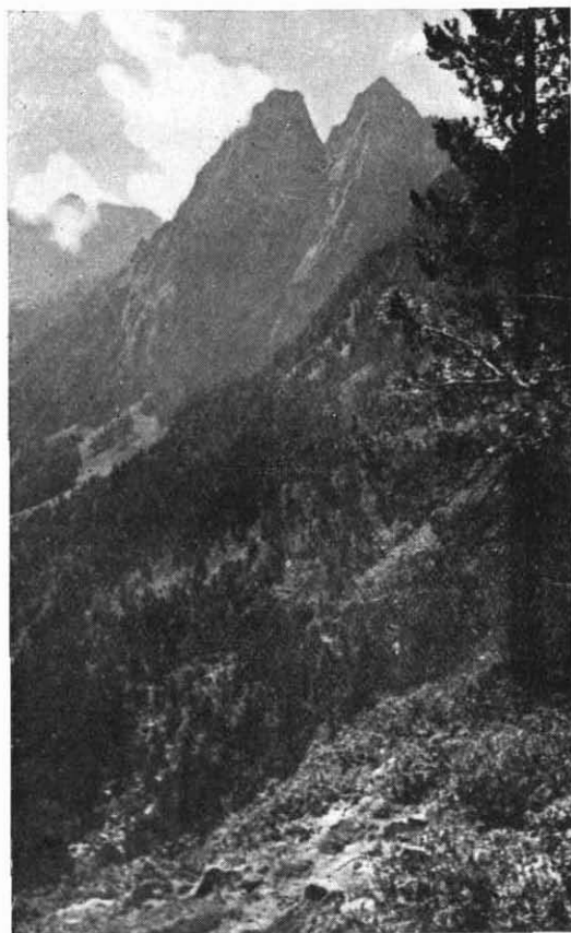
Els Encantats, desde el camino del Lago de San Mauricio al Portarrón de Espot .

característicos de la asociación de aquella especie de pino. Hacia los 2.250 m. subsisten aún los Rhododendron . A la misma vera del camino tropezamos con un añoso ejemplar solitario de Pinus uncinata el tronco del cual mide 18 palmos (3 m. 60) de circunferencia a 1 m. 30 del suelo.