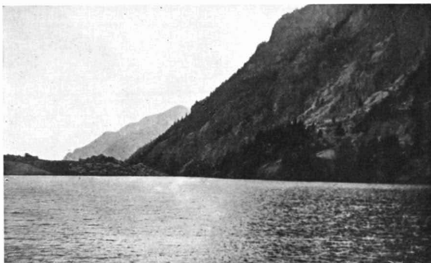
El Lago de Cavallers al atardecer

A hora prudencial de la mañana, montado sobre un apuesto mulo, abandono la acogedora fonda Benería, del pueblo de Boí (1.310 metros de altitud) con la intención de dar alcance a un grupo de compañeros que han salido del pueblo hace ya más de una hora, en dirección a Caldas de Boí y al Lago de Cavallers.