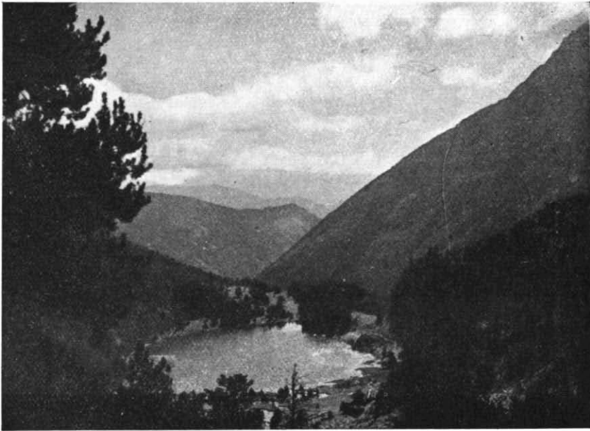
Lago de San Mauricio desde el camino del Portarrón de Espot

Norte de Els Encantats, mostrándose subordinado a aquél el Pinus uncinata Ramond. Este último trepa audazmente por las laderas y riscos de la solana, prácticamente hasta los 2.500 m. de altitud (1). El abedul ( Betula verrucosa Ehrh.) asciende hasta los 2.100 m., siendo notable por su corpulencia y talla (12-15 m. de altura \times 45 cm. de diámetro normal) un jemplar cercano a Pont de Espallers.