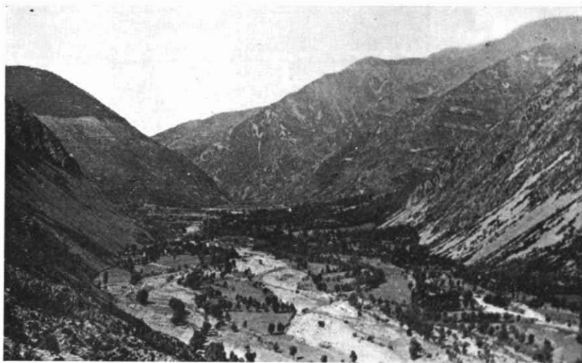
Aspecto general del valle de Boí, desde el camino de Boí a Barruerá

aplicaba indistintamente y en forma despreciativa, a todas las especies de pinos, a excepción del pino piñonero al que consideraban como único representante legítimo del género Pinus (por sus semillas y frutos, claro está); el otro era el de «micaleu», empleado corrientemente para designar el Prunus Mahaleb L., reminiscencia evidente del nombre mozárabe de dicha planta: mahabeb o mihaleb .