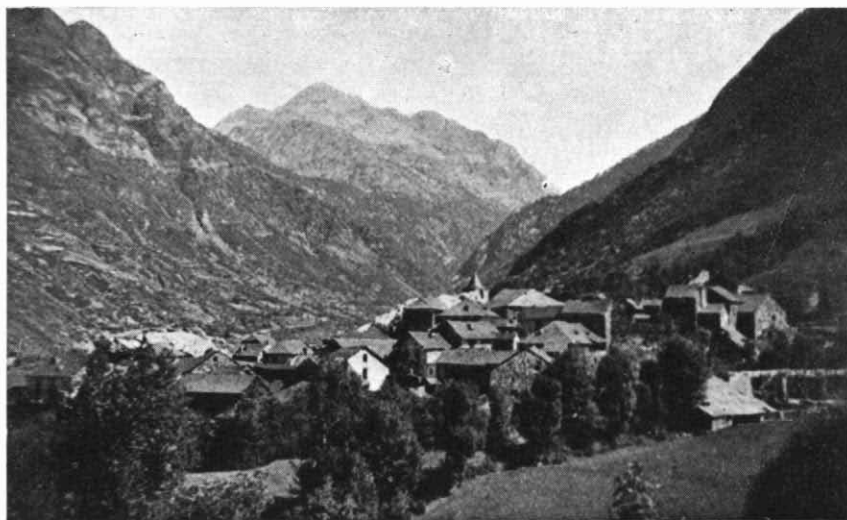
Vista general del simpático pueblo de Boí Al fondo, la mole impresionante del Comoliformo

Por referencias del botánico E. Sierra Ráfols, confirmadas por un práctico forestal de Espot y por una de las hijas de la hospedería Benería, de Boí, parece débese aceptar como cierta la presencia de