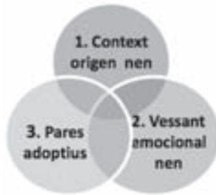
Figura 1. Variables a considerar en l'adopció internacional (Ballús, 2009)

Després d'una revisió exhaustiva dels estudis que s'han realitzat fins ara a l'entorn de l'adopció, hem concretat les variables que considerem més significatives, tant dins el marc de l'adopció internacional com per al nostre estudi (vegeu Figura 1).